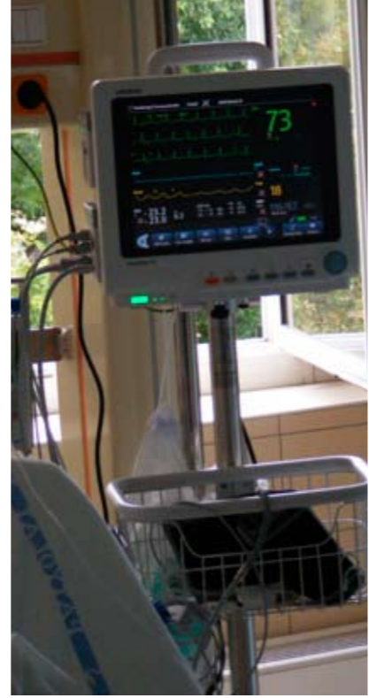
A koronária őrző egyik betegágy melletti monitora a Kardiológiai osztályon

A közel 60 millió forintból 8 millió forintért vásárolt a kórház egy szemfenéki kezelésre alkalmas lézer készüléket, 1,7 millió forintból egy speciális hallásvizsgáló eszközt az újszülöttek számára és jutott 7 millió forint egy mobil körtemi röntgenre is, valamint 10 milliós értékben ortopédiai műtétekhez használt eszközökre, ágytámasz berendezésekre. Dr. Bauer Kálmán elmondta: a folyamatban lévő uniós pályázati forrásokból is fejlesztje a kórház a műszerparkját, s a most felhasznált támogatással együtt jelentősen javultak a gyógyítás feltételei a kórházban.