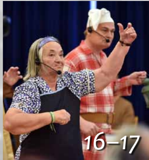
Művészettel a sérültekért