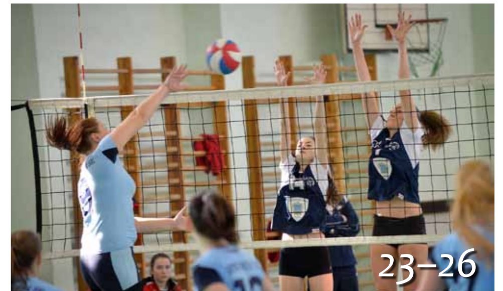
NB II-es junior bajnok az AGRIA RC EGER-EVSI