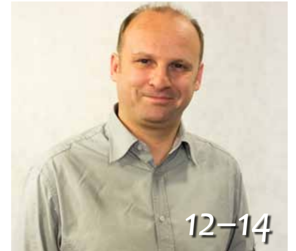
„A humor úgy kell, mint a levegő”