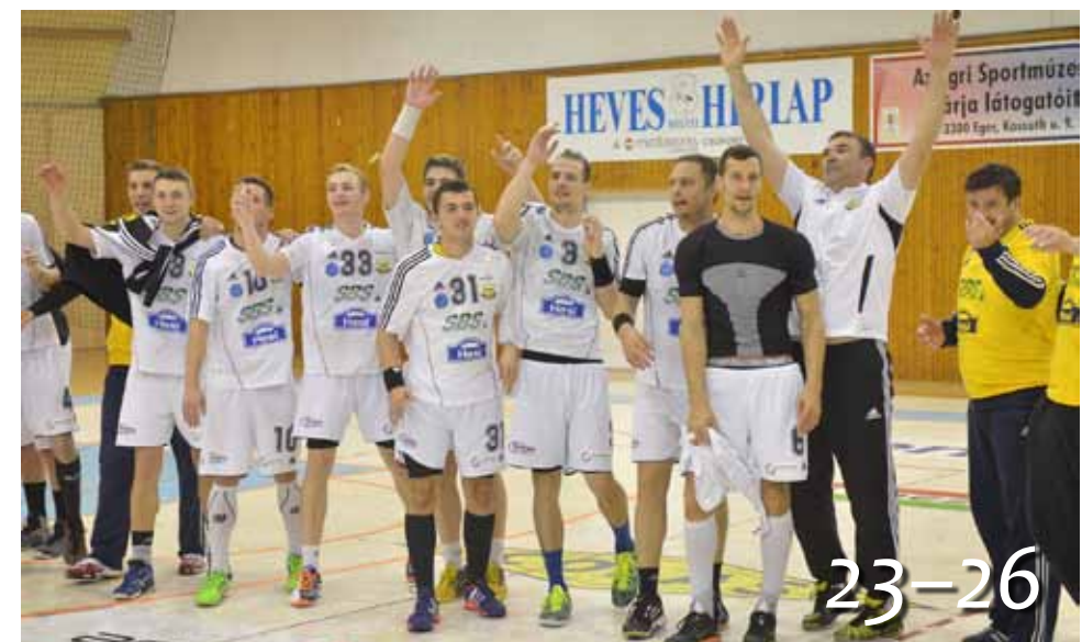
Irány az NB II!