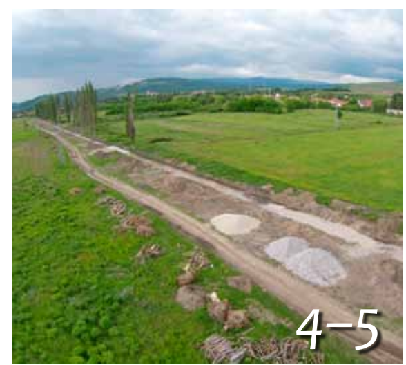
Épül a kerékpárút