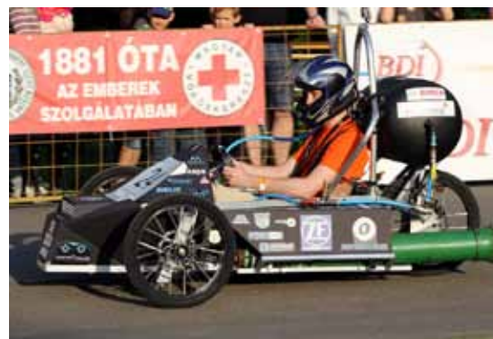
A győztes jármű