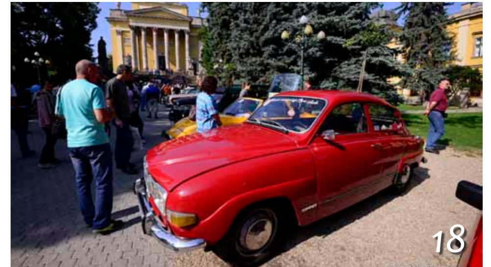
Veterán autók találkozója