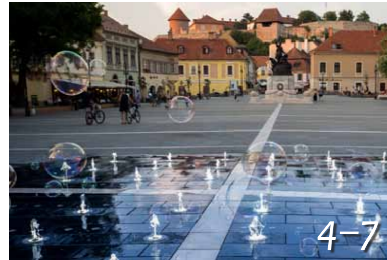
Megújult a belváros