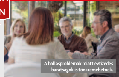
A hallásproblémák miatt évtizedes barátságok is tönkremehetnek.