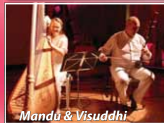
Mandu & Visuddhi