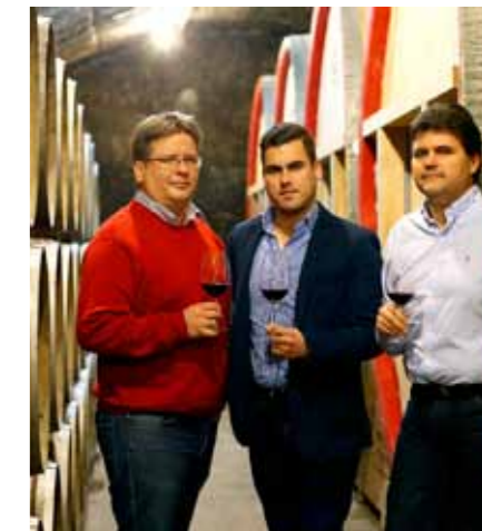
Juhászvin – Juhász Testvérek Pincészete

A Juhász testvérek 1996-ban alakult tradicionális pincészete a szép, és komoly borok létrehozását tűzte ki célul, melyeket az odafigyelés és különleges gondosság jellemez a telepítéstől a tölgyfahordós érlelésen át a palackba kerülésig. Éves szinten mintegy 300 hektár területéről 25 ezer mázsa szőlőt dolgoznak fel. Klaszikus családi vállalkozásról van szó, amelynek munkájába immár a második generáció is bekapcsolódott. A legmegfelelőbb termőhely kiválasztásával, a visszafogott terméssel és a legkorszerűbb feldolgozással garantálják boraik állandó jó minőségét. Munkájukat igazolják a hazai és nemzetközi versenyeken elért érmek és díjak.