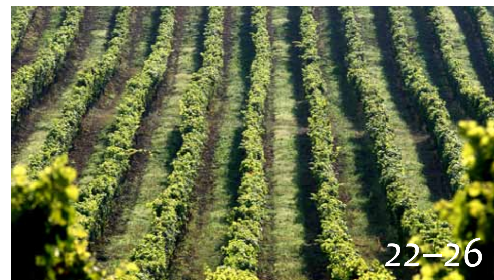
Egri borászok az OMÉK-on