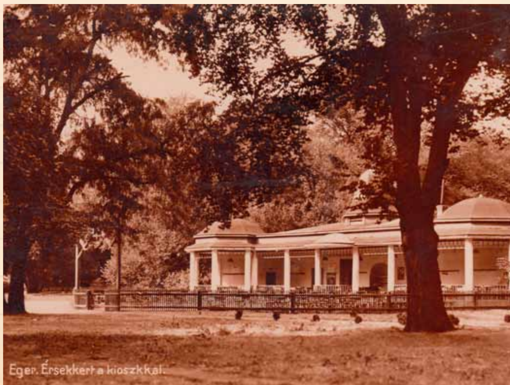
Eger, Érsekkert a kioszkkal.

Az Érsekkert közel 400 éves múltja során sokszor és sokat változott, de mind a mai napig a 14 hektáros zöldterületével az egriek egyik legkedveltebb pihenőhelye.