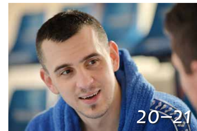
Sport – Egri olimpikonok