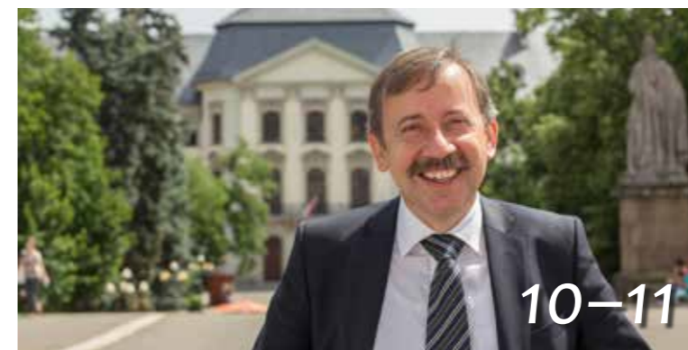
Egri egyetem, történelmi pillanat