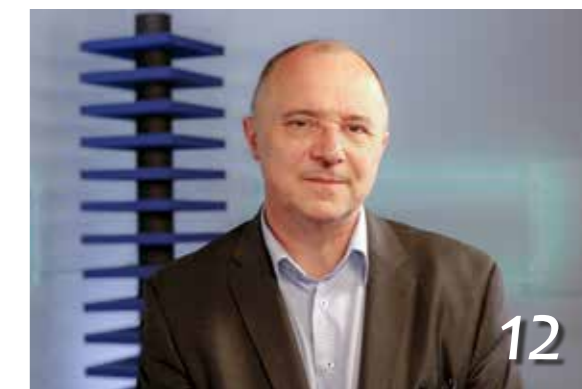
Új igazgató a kórház élén