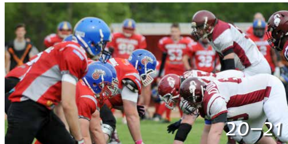
Bajnoki szezonzárás II.