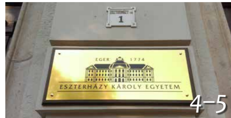
Egyeteme lett Egernek