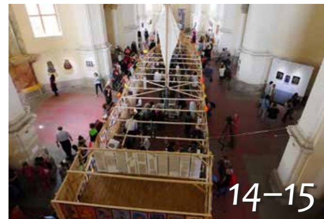
Mit visz a hajó?