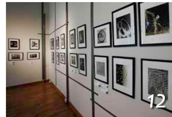
A világ új képe