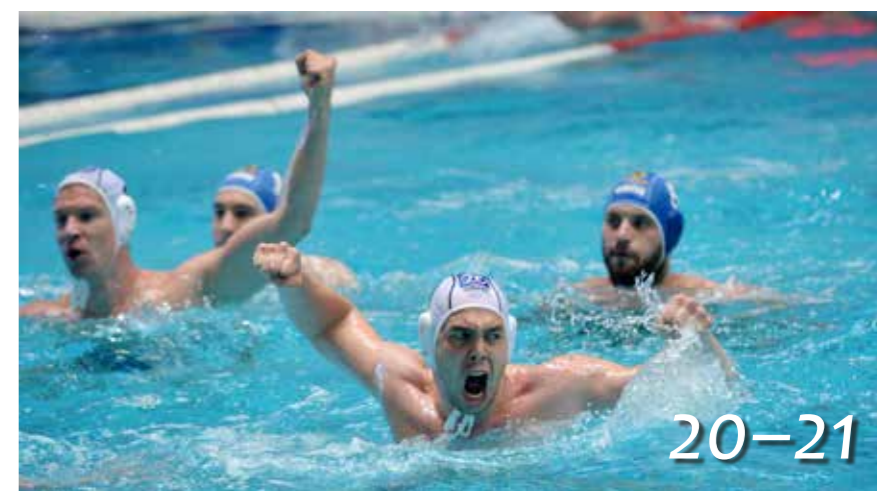
Bajnoki szezonzárás I.