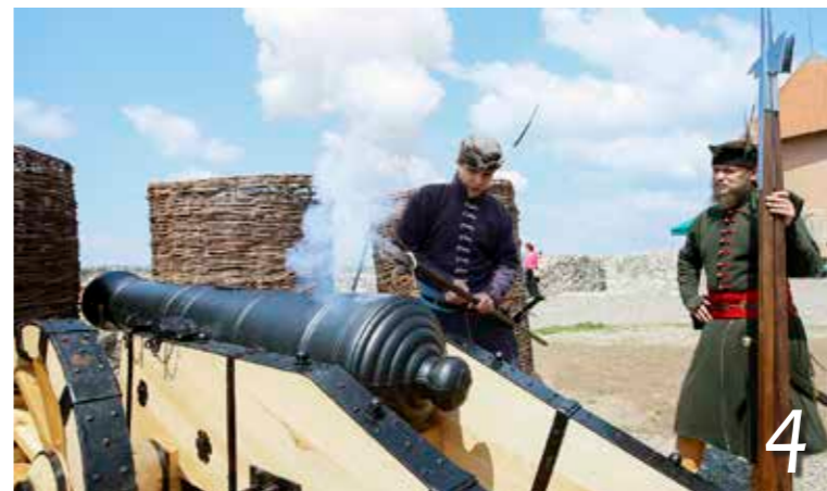
Befejeződött a várrekonstrukció