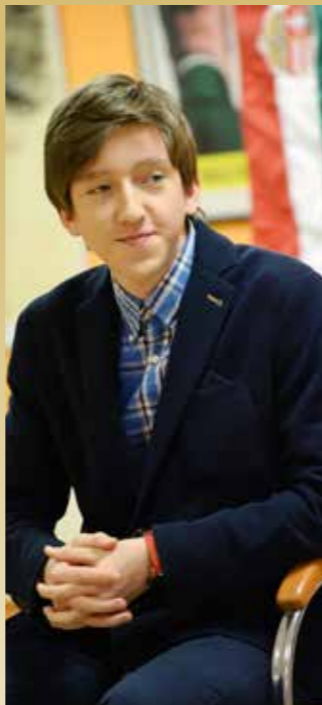
FOTÓ: LÉNÁRT MÁRTON

A Gibraltár Open az egyik legnevesebb nyílt sakkverseny. A legjobb 10 forduló versengésében 12 magyar versenyző indult. Közülük Rapport és Almási 7-7 ponttal lett a legeredményesebb, mégis a legnagyobb meglepetést az egri Gledura Benjamin okozta, aki világgal legyőzte a legutóbb 2013-ban világbajnok indiai Viswanathan Anand nagymestert. A tornán 6,5 pontot gyűjtő és veretlen 16 éves nemzetközi mester a Nagykanizsa NB I-es csapatában játszik. Korábban – rapid versenyen – már Anatolij Karpovot is legyőzte.