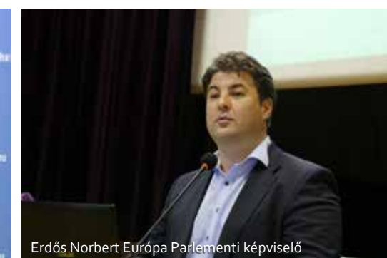
Erdős Norbert Európa Parlamenti képviselő