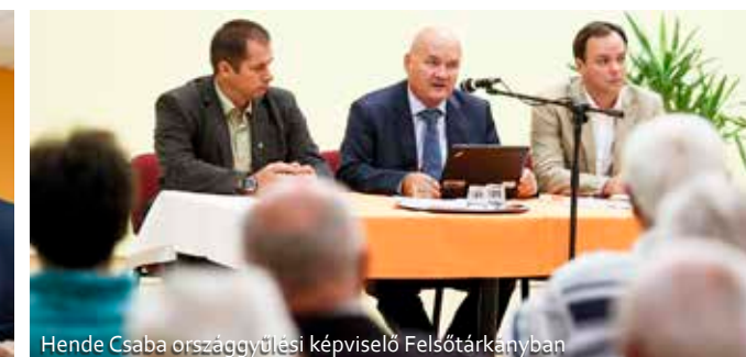
Hende Csaba országgyűlési képviselő Felsőtárkányban