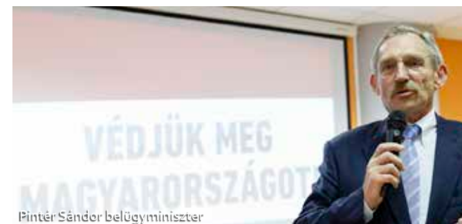
Pintér Sándor belügyminiszter

Az utóbbi időben szinte minden a népszavazásról, a migrációról szól, sokan sokféleképpen vélekednek. Egerben és a környező településeken is többször lehetett hallani a témáról. Az utóbbi hetekben Nyitrai Zsolt országgyűlési képviselő, miniszteri biztos meghívására többek mellett Pintér Sándor Magyarország belügyminisztere, Hende Csaba országgyűlési képviselő, volt honvédelmi miniszter, Erdős Norbert Európa parlamenti képviselő, valamint Bakondi György a miniszterelnök belbiztonsági főtanácsadója is kifejtette véleményét az Európai Bizottság által kezdeményezett kötelező betelepítési kvótával kapcsolatban.