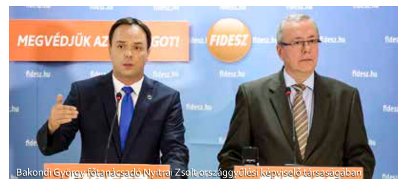
Bakondi György főtanácsadó Nyitrai Zsolt országgyűlési képviselő társaságában