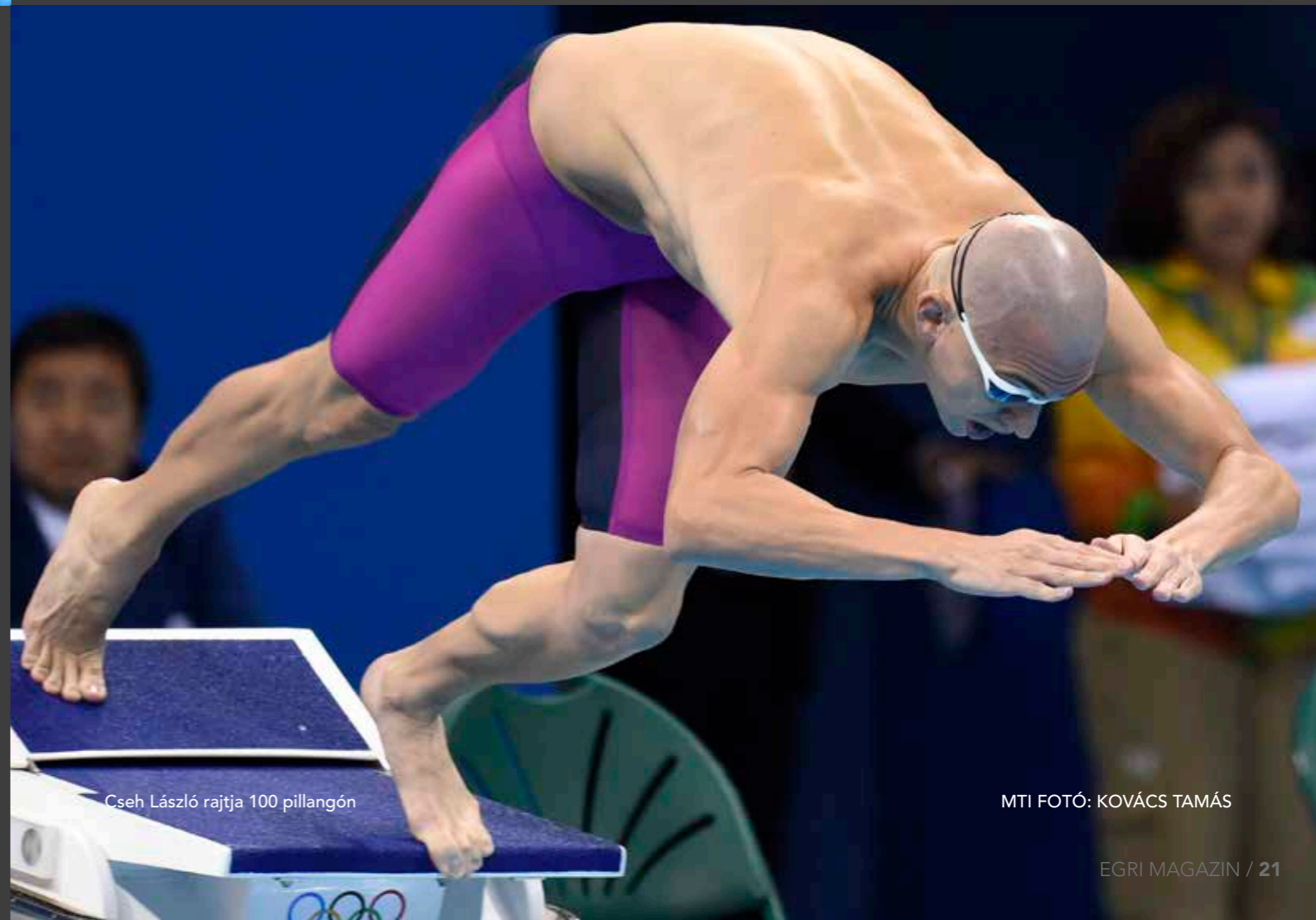
Cseh László rajtja 100 pillangón

– Nem tudom, mi történt velem az utolsó ötven méteren, na-