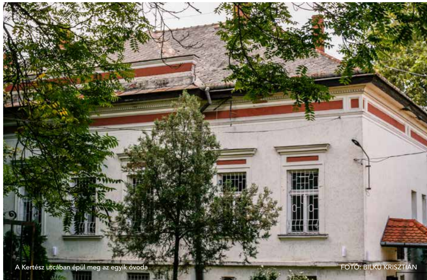
A Kertész utcában épül meg az egyik óvoda