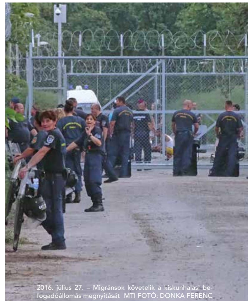
2016. július 27. – Migránsok követelik a kiskunhalasi befogadóállomás megnyitását

Mit jelent az, hogy terror vagy terrorizmus? Nagyon nehéz megfogalmazni, igazából egzakt fogalma nincs a terrorizmusnak. Több megfogalmazása létezik, minden megközelítés más és más, de a terrorról mindenkinek eszébe jut, hogy valamilyen cél elérése érdekében alkalmaznak félelemkeltést, vagy valamilyen erőszakos jellegű cselekedetet.