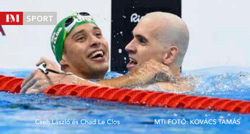
Cseh László és Chad Le Clos