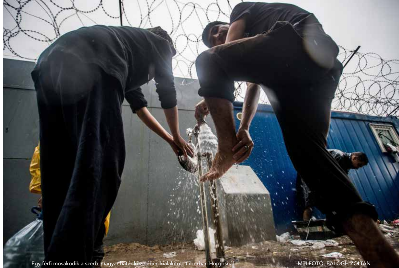
Egy férfi mosakodik a szerb–magyar határ közelében kialakított táborban Horgosnál