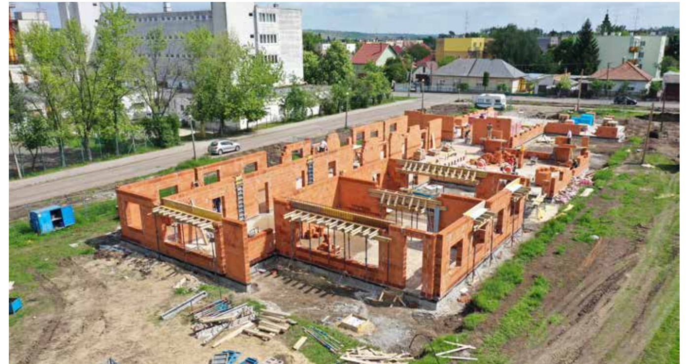
Pozsonyi utca – Ifjúság utca: épül az új óvoda

– Természetesen, de amint jeleztem, nem kívánok mindent felsorolni. Alá kell húzni tehát, hogy ebből a sorból szándékosan kihagytuk a belvárost és térségét, ugyanakkor Eger számára nagyon fontos a történelmi belváros fejlődé-