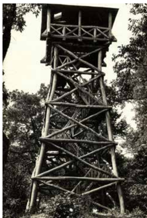
A dr. Szmrecsányi Lajos kilátó

Az egri turisták később sem vetették el az Eger-patak völgyére néző kilátó építésének ötletét. Viszont az első ilyen építmény végül nem az Egeden, hanem a „szomszédos” Várhegyen valósult meg. A Magyar Turista Egyesület Egri Bükk Osz-