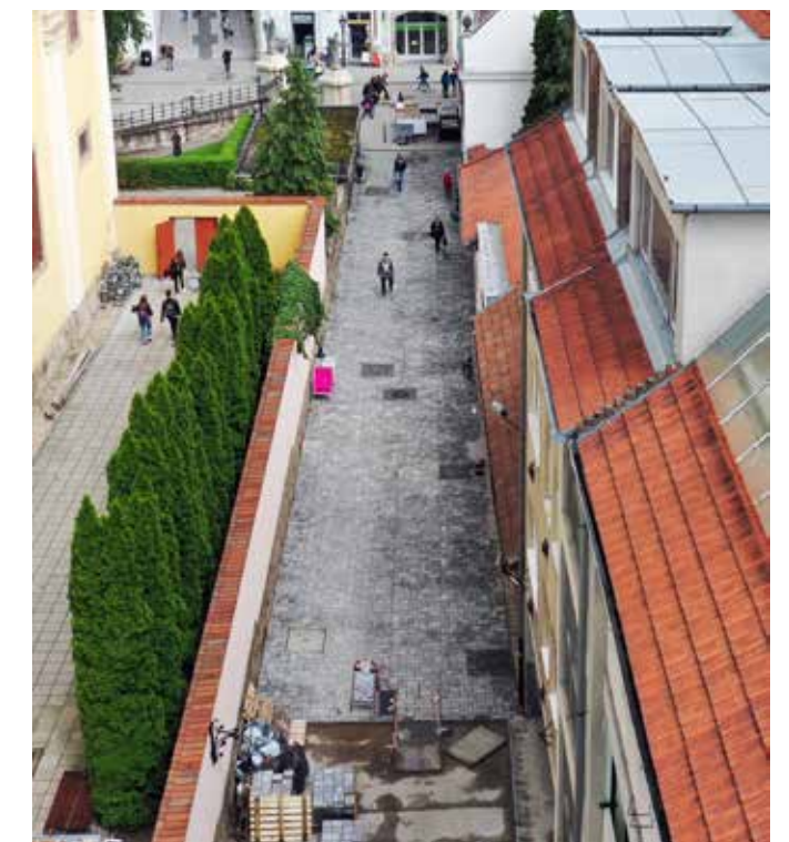
Bródy Sándor utca

7-8 éves, illetve másfél-két évtizedre előremutató fejlesztési stratégiát (IVS). Ezt a Közgyűlés hagyta jóvá, minden képviselőnek illik ismernie a dokumentum tartalmát, akár a testület tagja volt akkor, akár nem. Ez ma is a vezérfonalunk, a beruházási csomagokat ez alapján állítottuk össze, s a kormányzattal való egyeztetéseket is ez alapján végezzük. Felsorolni is sok lenne, hányféle egyeztetés, kutatás, felmérés előzte meg a stratégia megalkotását. Persze azóta is vannak konzultációk, fórumok, szakmai felmérések egyes szakterületekre, vagy éppen társadalmi csoportokra vonatkozóan. Most épp a fiatalokkal folytatunk intenzív