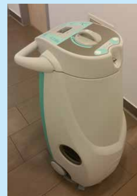
Az ultramodern légtér-fertőtlenítő

– Nagyon sokat tehetnének ezen a területen. Különösen járványos idő-