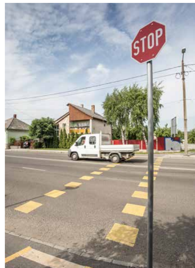
Felnémet, Egri út