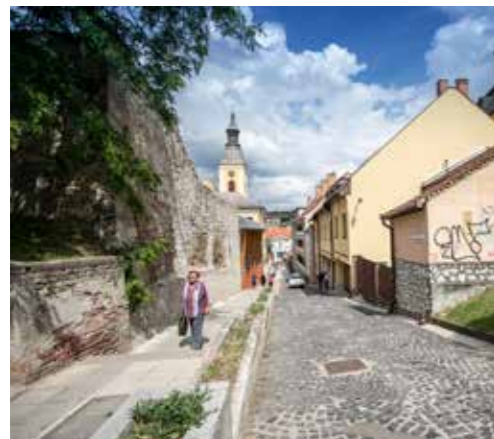
Bródy Sándor utca

A Stadion utcában megújítjuk az útpályát és kétoldali járdát (80 M Ft), az Arany János utcai óvodánál két-, a Kodály Zoltán utcai nevelési intézmények környékén pedig