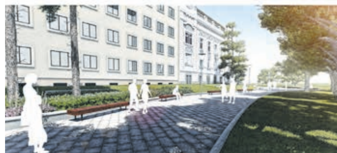
Látványtervek és a jelenleg zajló munkálatok, Hatvani kapu tér