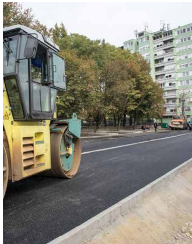
Malom utca, parkoló

A harmadik tényező az, hogy a fejlesztéseket egy működő, lüktető városban valósítjuk meg. Az elmúlt években a bölcsődéket például úgy újítottuk fel, hogy teljes kapacitással, 100%-ban működött az intézményhálózat. Ez volt a családok érdeke és ezt a szakemberekkel, dolgozókkal együttműködésben meg is oldottuk. Most is van hasonló ügyünk folyamatban a Lajosvárost érintően, s elmondhatom, hogy több intézménnyel együttműködve, nagyon sokat dolgozunk azon, hogy a lehető legjobb ellátást kapja minden érintett. A beruházásokat összefogással, „szolgáltatási szünet