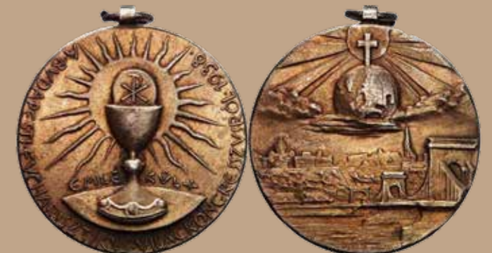
1938-as eucharisztikus világkongresszus emlékérmé