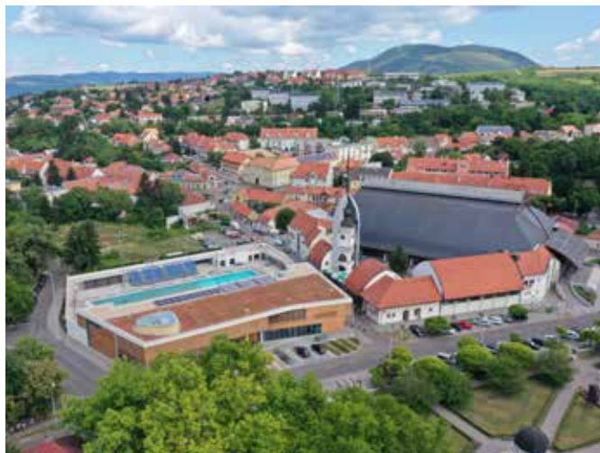
A dr. Bárány István Sportuszoda és a Bitskey Aladár Uszoda

– Négyéves koromtól dzsúdódom – mondja Bence –, s hogy ilyen eredményesen, az nem kis részben köszönhető annak a nagyszerű légkörnek, ami az egész sportiskolára és a szakosztályomra egyaránt jellemző, hiszen tényleg úgy járok oda, mintha csak haza mennék.