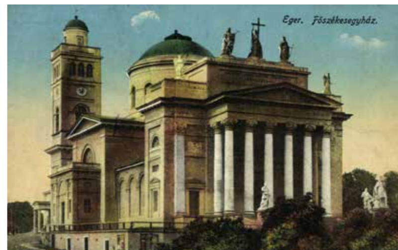
Eger Főszékesegyház (képeslap 1915-ből)

– A turizmus szempontjából jelenleg a templom mindkét tornya használhatatlan. A déli, Lajosváros felé néző csak a sekrestye felől közelíthető meg, így a látogatók előtti megnyitása nem lehetséges. Ellenben a belváros felé néző torony és annak megközelítése megoldható. Ez annál is inkább érdekes lesz, mert ez volt a régi városi tűzország megfigyelő tornya. Ezt szeretnénk majd ismét megnyitni, látogathatóvá tenni. Az Érseki Levéltárban nagyon sok értékes adat van arról, hogy milyen volt az eredeti külseje és belső tere az épületnek. A Bazilika eredeti színe sokkal visszafogottabb volt. Ez az erős okkersárga 1981-től jellemzi az épületet. Sokkal szerényebb lesz az új külső. A közvetlen környezet is megújul majd. A falak mellett és azok közelében álló fákat – többségében magról kelt fenyőket – ezekben a napokban távolítják el, hiszen ezek gyökerei lényegében az épület alá – ahol altemplom is található – vezetik a nedvességet. Ha valaki korábban körbejárta a Bazilikát, látott egy szép épületet, amelynek környezete nem túl szép. Véletlenszerűen berakott halszállkás parkolók, töre-