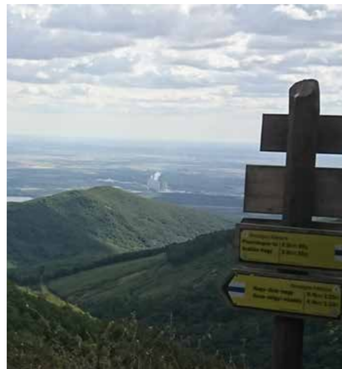
Kilátás a Sas-kőről a Mátrában