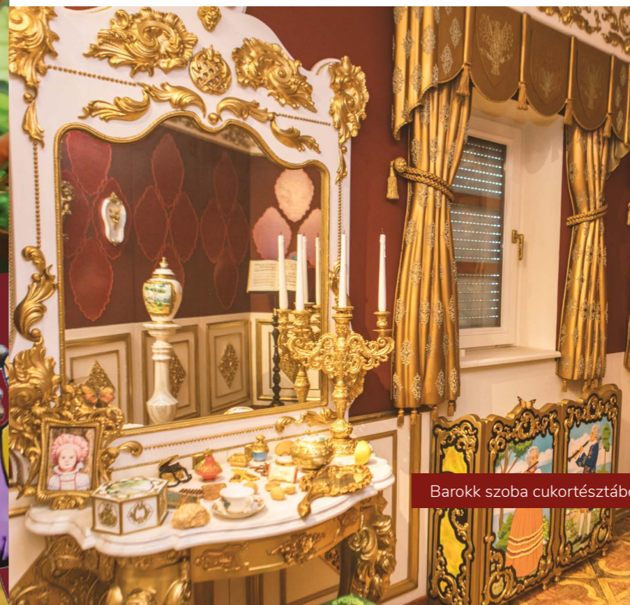
Barokk szoba cukortésztából és glazurból