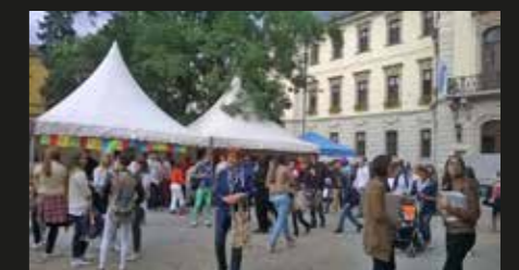
(Képünk egy korábbi rendezvényen készült.)

Helyszín: Pyrker tér, Eszterházy tér Időpont: szeptember 22.