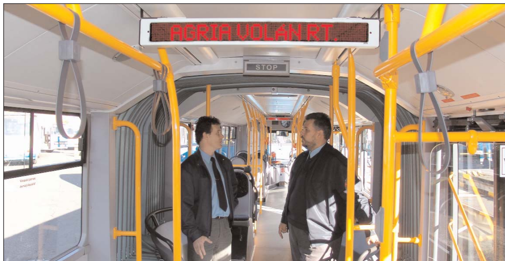
Az Agria Volán korszerű buszainak egyikén