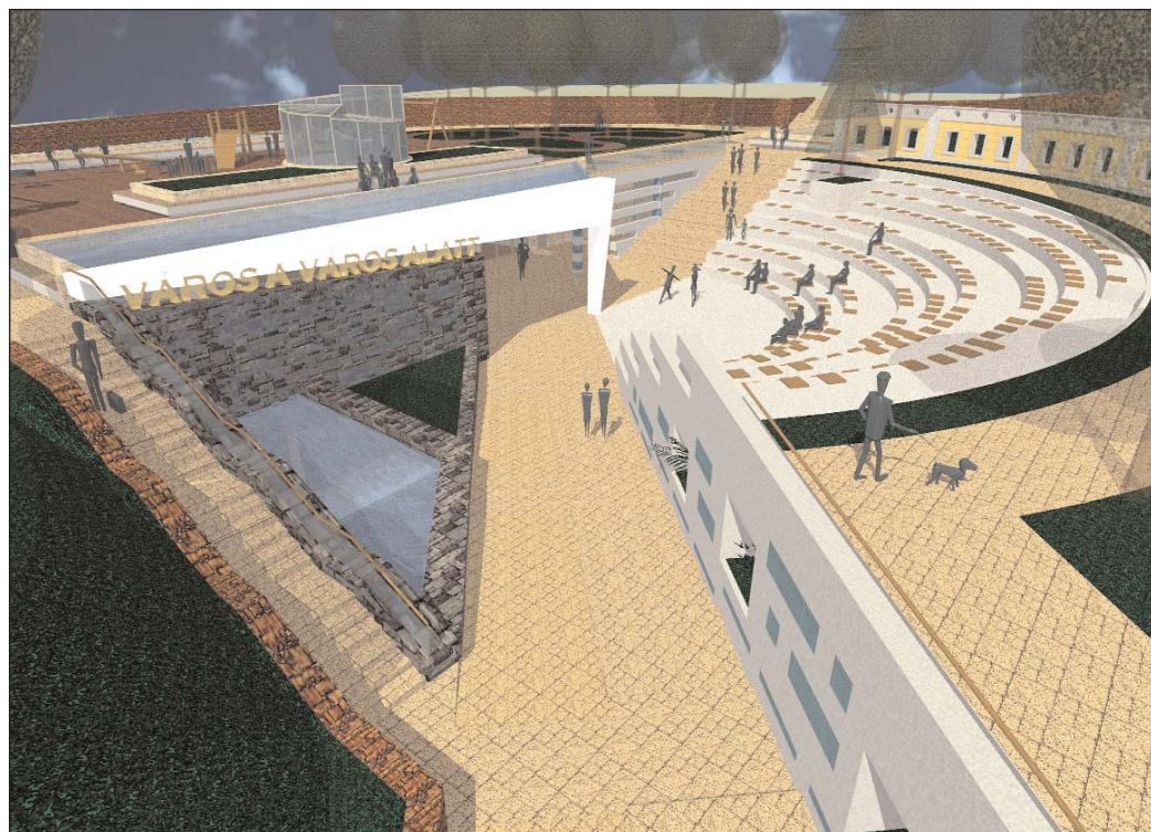
Látványterv a Város a város alatt projekthez