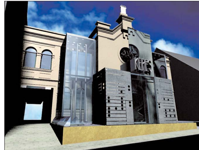
A Kepes Központ látványterve. A Nagyszinagógában valósul meg .

Változás, hogy néhány OKJ-s szakmában a képzési idő kitolódik. A korábbi 2+2 évről, 2+3 évre növekszik a cukrász, az asztalos, a kőműves, a nőruha-készítő, a fodrász, a szobafestő-mázoló és tapétázó, a gázvezeték- és központifutás-szerelő szakmákban.