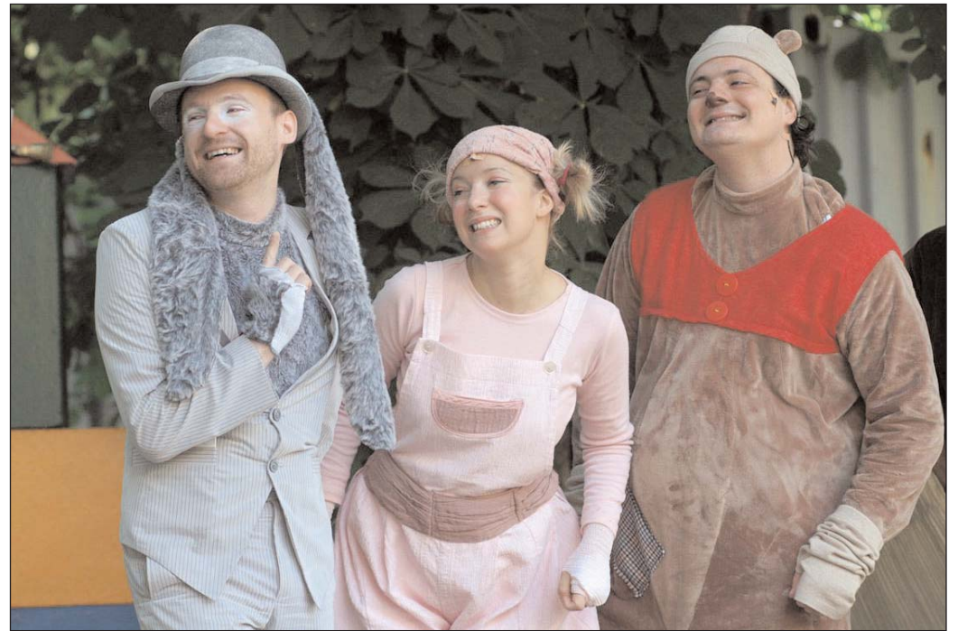
A Micimackót ősszel a kőszínház is bemutatja