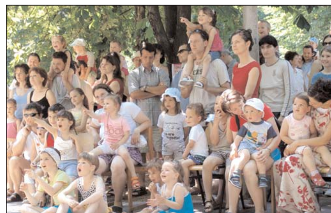
GYERMEKNAP. Gyönyörű napsütéses idő, gazdag programkínálat. Ez jellemezte május utolsó vasárnapjának gyermeknapját — többek között az Érsekkertben.