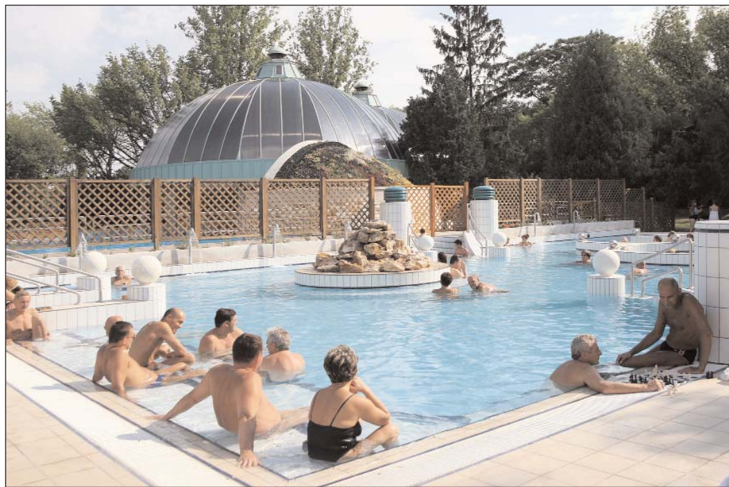
Számos szabadidős, illetve sportlétesítmény újult – vagy újul – meg a városban az idei esztendőben: a termálfürdő, a felsővárosi sportkomplexum, valamint a Városi Stadion tartoznak ebbe a sorba. Ezekről a beruházásokról, illetve rekonstrukciós munkákról ezen az oldalon bővebben is olvashatnak