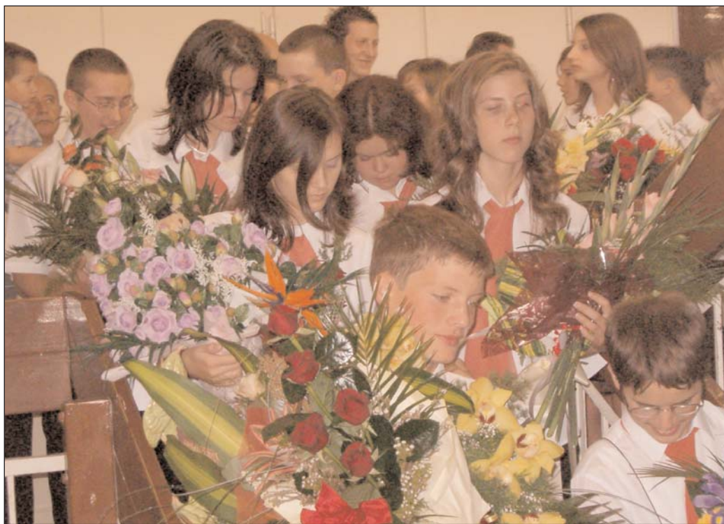
Elballagtak: utolsó séta a Balassi Bálint Általános Iskolában