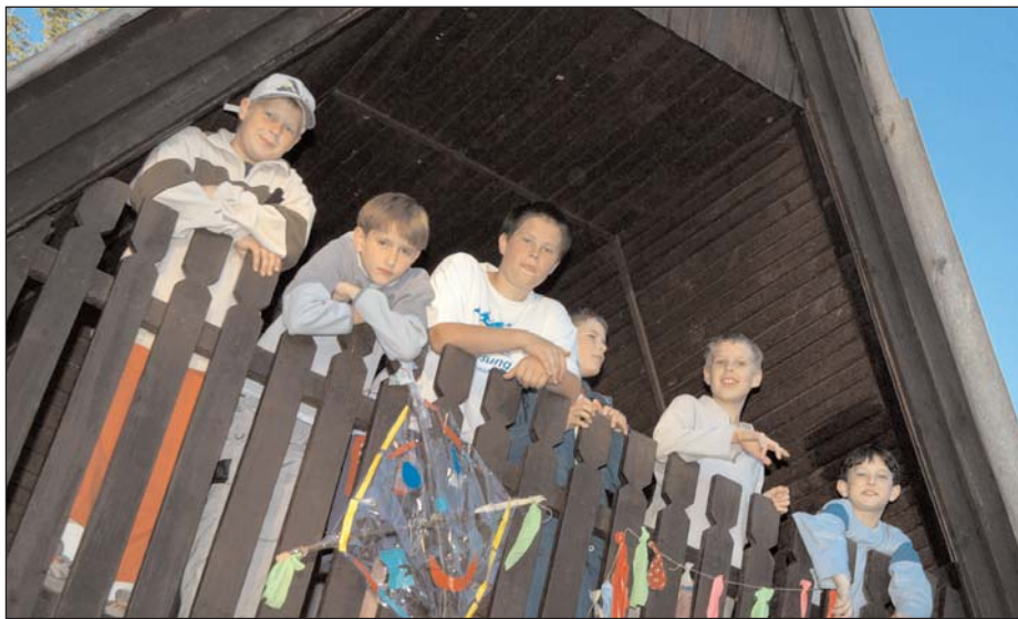
Jó hangulatban: egri iskolások az Imókó Üdülőben

A tábor célja a Városi Diák Tanács hatékonyabb működésének kialakítása, új tagok beilleszkedésének megkönnyítése, valamint az iskolai diákönkormányzati munka segítése.