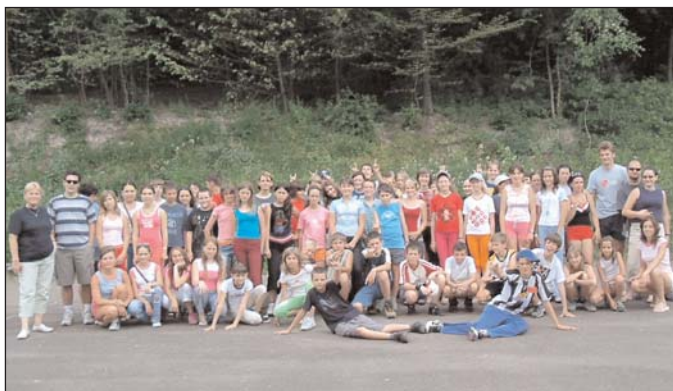
Az imóköi nemzetközi tábor résztvevői jól érezték magukat