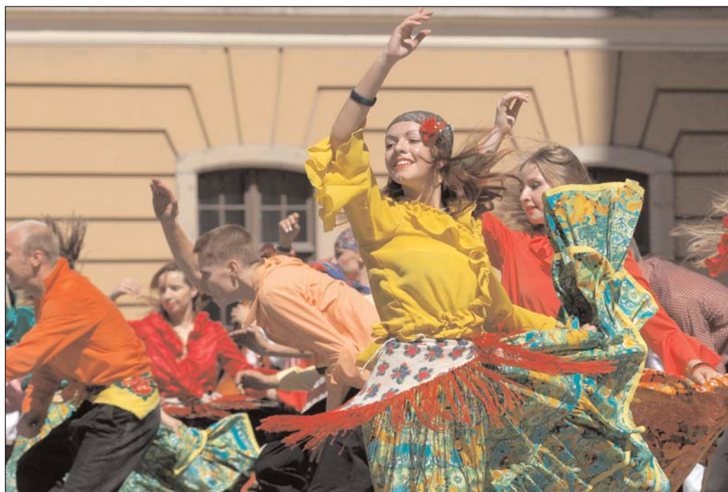
Eger kulturális életében mindig is jelen volt Európa: nem csak a különféle fesztiválokon fellépő együttesek, hanem a rendezvényeket látogató érdeklődők közül is számosan jöttek és jönnek a határainkon túlról