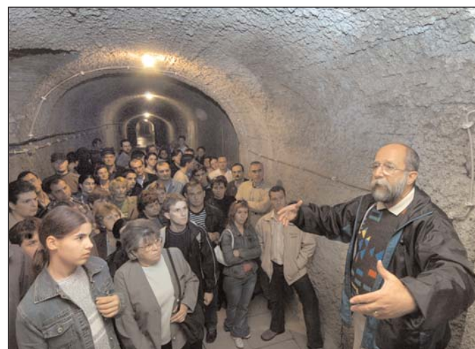
A város alatt: az érseki pincerendszer már látogatható

Az Európa Kulturális Fővárosa 2010 akcióorozat lehetőséget ad arra, hogy egy európai szakemberekből álló team átformálja Eger legnagyobb lakótelepének arculatát. A város vezetése a program kivitelezésében elsősorban fiatal építészeket, mérnököket, kertépítőket, tudósokat és képzőművészek részvételére számít, akiket team munkára hívnak meg.