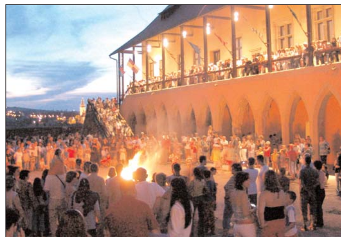
Szent Ivánkor százak éjszakáztak a várban

A váruddvaron sokan beálltak a kőrtáncba, és meglelték az ingyen látogatható kiállítóhelyek is. Tíz óra előtt meggyulladt a Szent Iván éjszakájára emlékeztető fáklya is. Az előzetes tervekkel ellentétben - a tömeges érdeklődés miatt - az idegenvezetős Kazamata látogatást egy összevont vonulás váltotta fel.