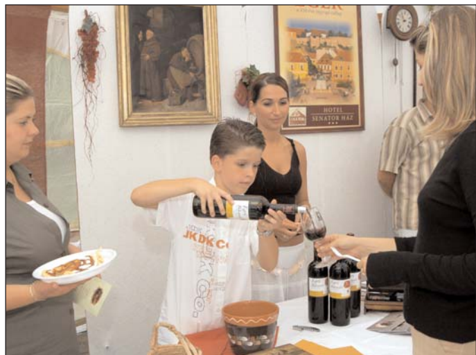
A bikavér kínálását nem lehet elég korán kezdeni