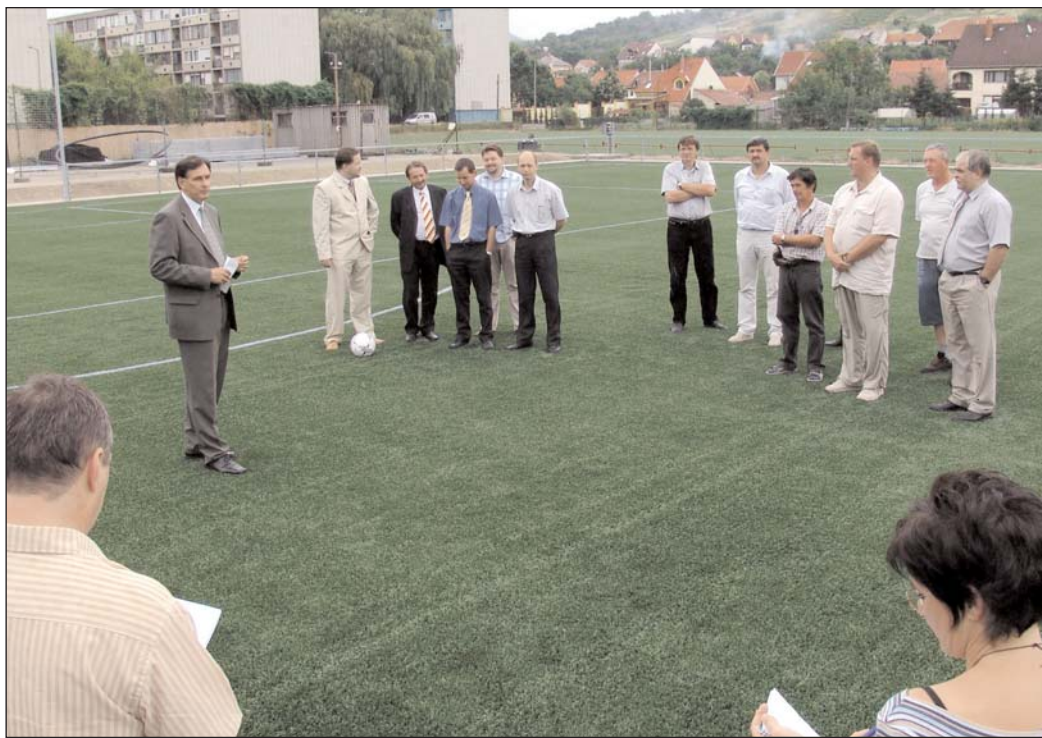
A közgyűlés tagjai ismerkednek a létesítménnyel, a hivatalos avatás július 30-án lesz

A Felsővárosban megvalósuló labdarúgó sportcentrum-beruházás fontos állomásaként elkészült a 105x66 méteres műfüves nagypálya. A városi közgyűlés legutóbbi ülésének színterében a képviselők meg is tekintették a létesítményt.