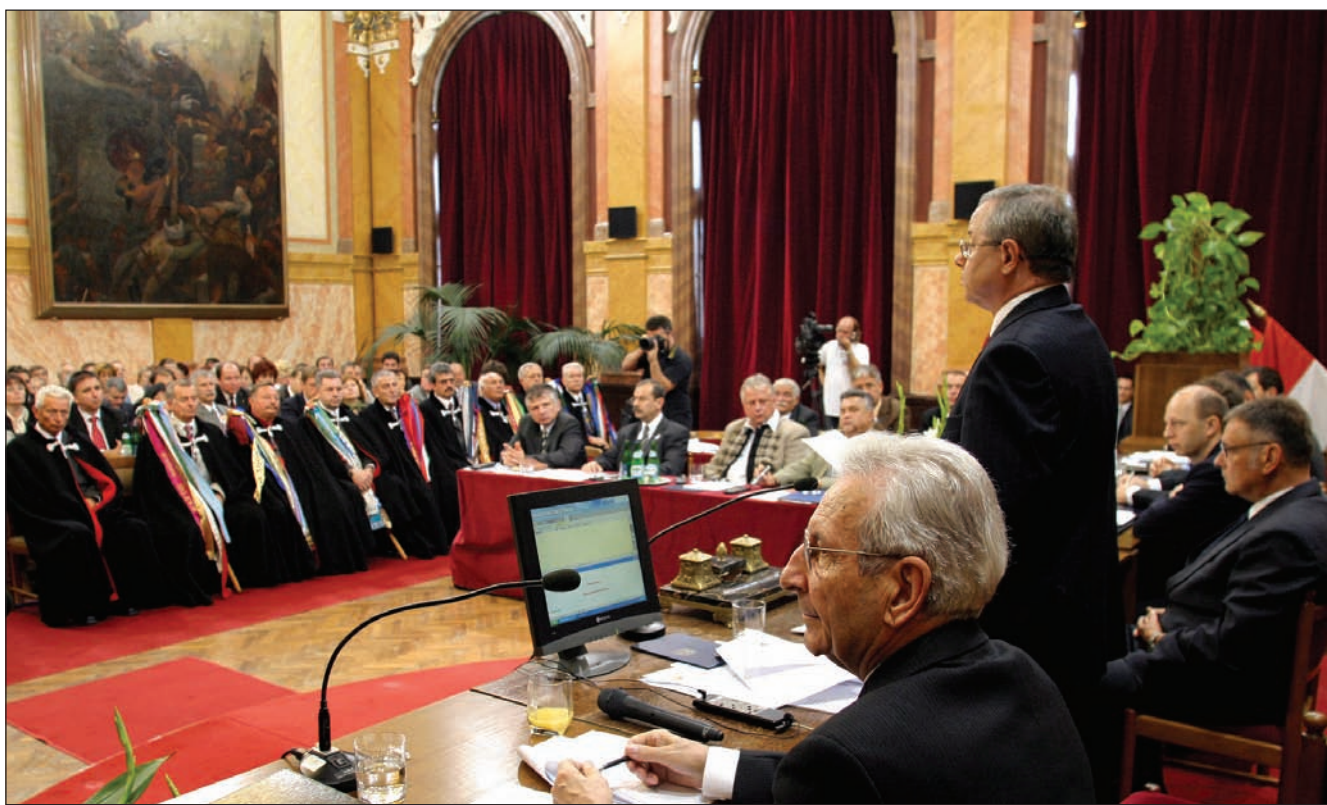
A testületi munka javítása elengedhetetlen. Ennek egyik záloga lehet, ha ésszerű kompromisszumok születnek a város érdekében

- Valóban felforrósodott a politikai hangulat az utóbbi időszakban. Ebben a helyzetben sem lehetnek azonban más céljaim, mint amelyek nyugodtabb légkörben lennének. Így elsősorban a képviselő testületi munka javítását tartom igen fontosnak. Természetesen amikor az ember értékeli a helyzetet, jó, ha előbb mindig a saját lehetőségeit és felelősségét vizsgálja meg. Ennek megfelelően a későbbiekben alaposabb, körültekintőbb