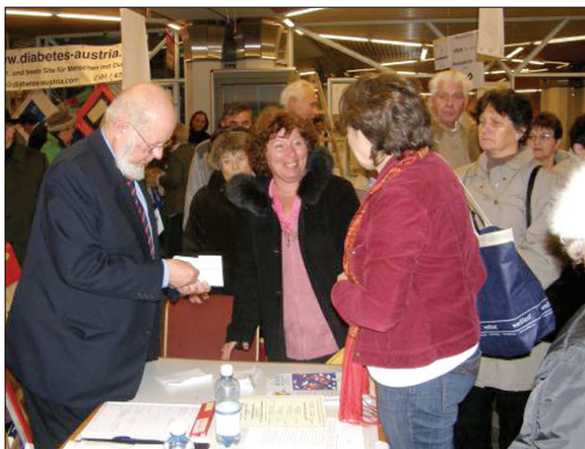
Tavaly decemberben helyezték ENSZ védnökség alá a Cukorbeteg Napot

A cukorbetegek számát a világon 240 millióra becsülik, Magyarországon mintegy hatszáz ezer a cukorbeteg él. Legálább ennyi lehet a még fel nem ismert, kezeletlen cukorbeteg is. Az előrejelzések szerint ezek a számok 10-15 éven belül megduplázódhatnak, ha nem fordítunk kellő figyelmet a megelőzésre. A Cukorbeteg Egri Egyesülete azért dolgozik, hogy felvilágosítással csökkentse a betegség kialakulásának veszélyét, korai kiszűréssel és megfelelő kezeléssel pedig megelőzze annak szövődményeit. Az oktatásán túl ebben az évben már kétezer ingyenes vércukormérést végeztünk, kiszűrve sok cukorbeteg, akik korábban nem is tudtak betegségükről. Mertünk vércukrot a Zsinagógában, a Szív Kiállítás idején, minden hónapban az Egri Civil Házban a klubfoglalkozásokon, a májusi Egri Diabetes Hétvégén, Eger Ünnepe, az Egerszőláti Falunapon, az Egri Egészségnapon és november 17-én az Egri Diabetes Világnapon. A Világnap alkalmából az egri rendezvényen kívül más megmozdulást is szervezett egyesületünk, hogy minél több embert figyelmeztessünk a cukorbetegség veszélyeire. November 10-én ötven egri és Eger környéki