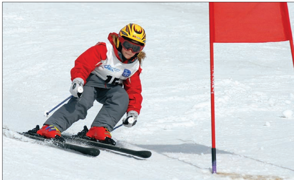
A versenyzéshez a szervező házigazdák a lehetséges legjobb feltételeket biztosították

A legtöbb egri egyelőre csak hallomásból tud a testvérvárosi kapcsolatokról, pedig Egernek sok országban van partnere. Am a kapcsolatok eddig többnyire kimerültek vezetői látogatásokban, s még a legjobb eset-