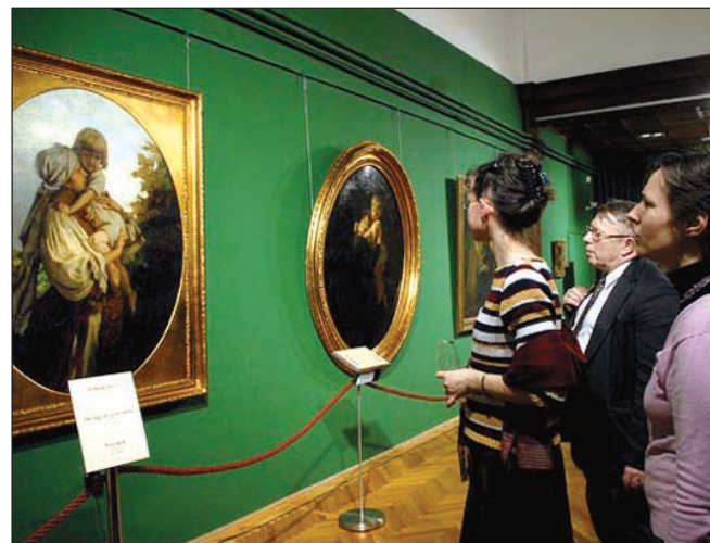
A Zsinagóga Galériában június 1-ig tekinthető meg a Székely Bertalan-tárlat

A Munkácsy-kiállításához hasonlóan ezúttal is ingyenes interaktív tárlatvezető-rendszer segíti a festmények és az alkotó életének, művészetének részletesebb megismerését. A szolgáltatás öt nyelven - magyar, angol, német, lengyel és orosz - vehető igénybe. Előzetes bejelentkezés alapján diákcsoportoknak a múzeum pedagógiai foglalkozást biztosítanak.