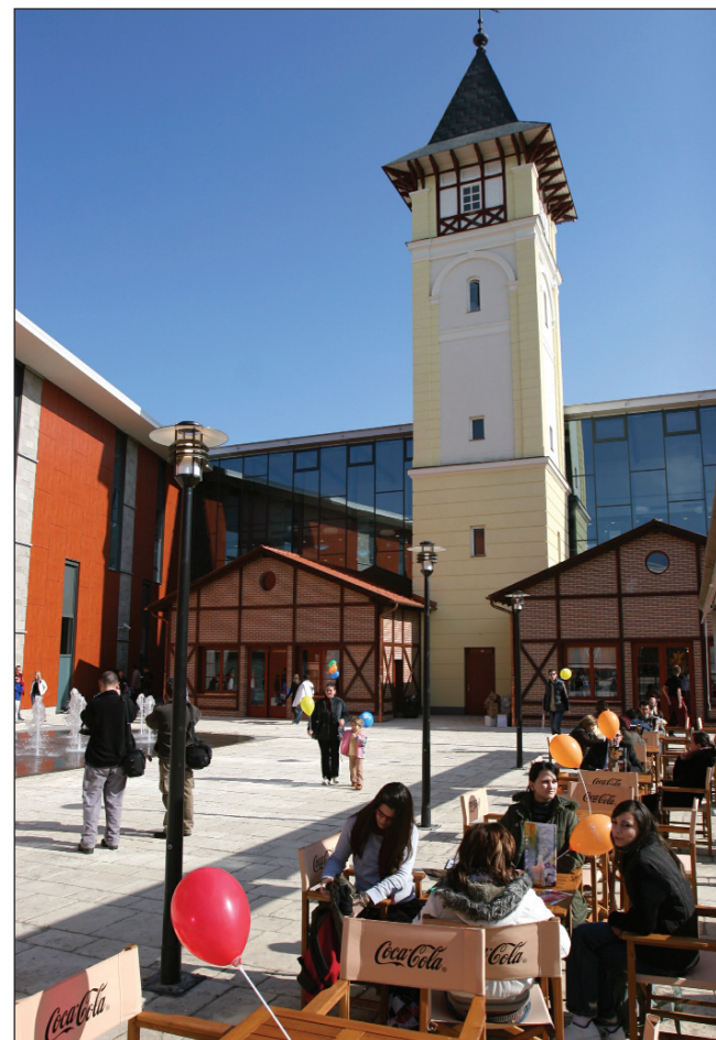
AGRIAPARK. A közelmúltban megnyitotta kapuit az egykori dohánygyár helyén épült - az egri lakosok szavazatai alapján Agriaparknak keresztelt - bevásárló és szórakoztató központ. Az impozáns létesítményt már az első hét végén mintegy nyolcvanezer látogató kereste fel, akik megtapasztalhatták, hogy a különféle üzletek mellett a pihenést szolgáló egységek is szép számmal találhatók itt.

A fórumok 16 órakor kezdődnek a Városháza Dísztermében (Eger, Dobó tér 2.). Minden érdeklődőt vár a főépítési csoport.