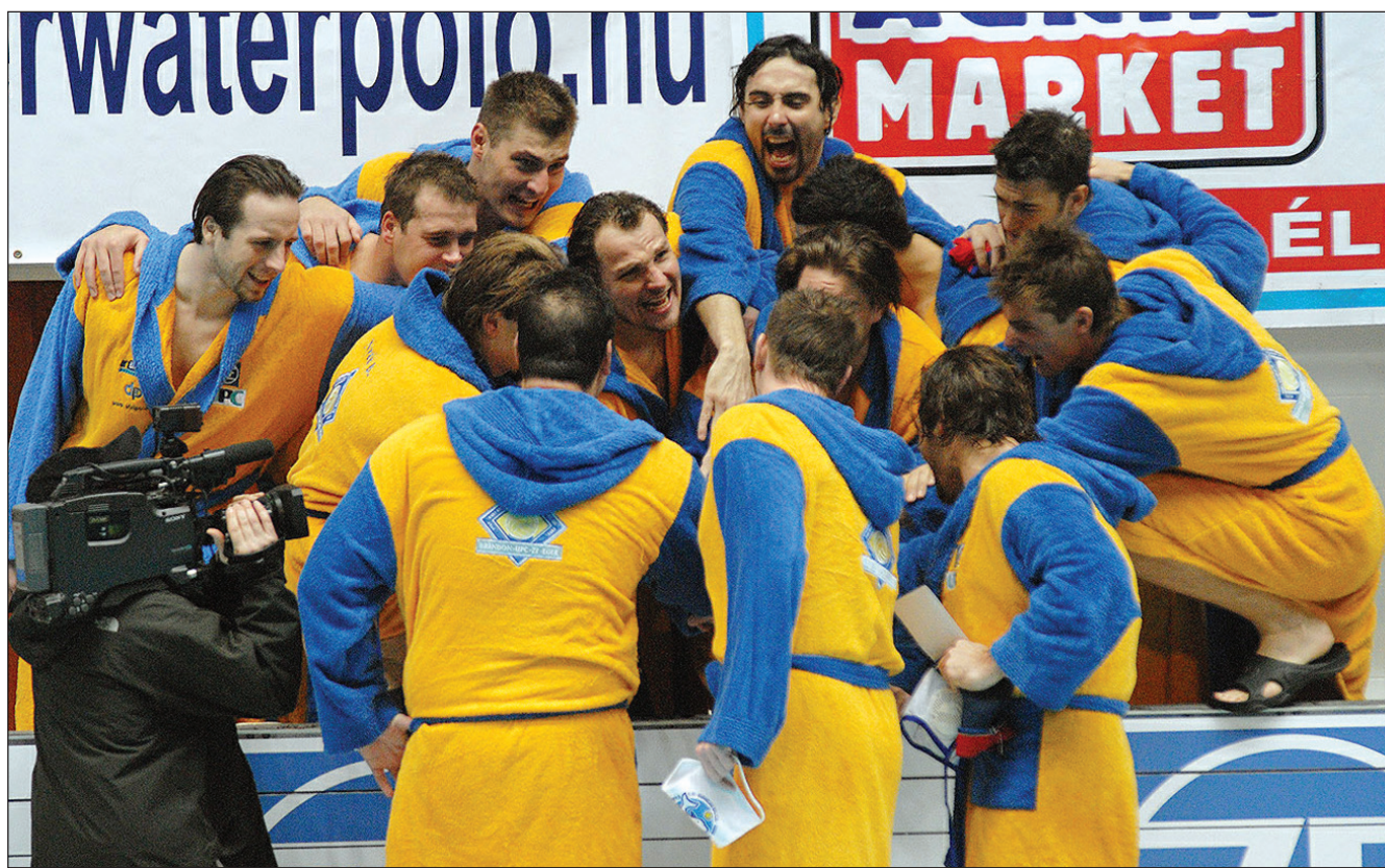
Kitörő öröm a medence partján a 11:7-re megnyert mérkőzés után.

Március 15-én este az egeri vízilabdasporthoz eddigi legnagyobb nemzetközi sikerét érte el, amikor a montenegrói Budvanska Rivijera 11:7-es legyőzésével bejutott a LEN-kupa döntőjébe.