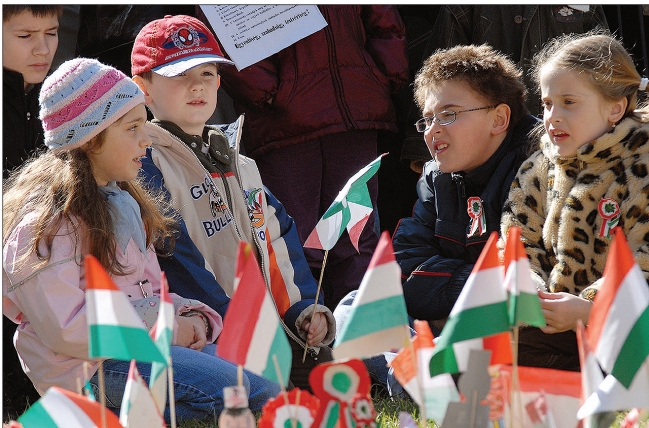
Az 1848-as forradalom és szabadságharc 160. évfordulóján kicsik és nagyok együtt ünnepeltek a Petőfi téren