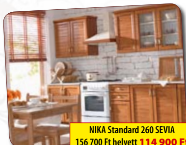
NIKA Standard 260 SEVIA 156 700 Ft helyett 114 900 Ft

Az akció 2010. szeptember 27-től november 6-ig, illetve a készlet erejéig tart.