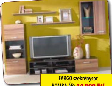
FARGO szekrény sor BOMBA ÁR: 44 900 Ft!