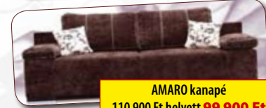
AMARO kanapé 110 900 Ft helyett 99 900 Ft