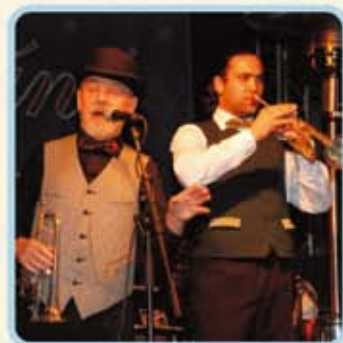
Budapest Ragtime Band

A Gárdonyi Géza Színház Szervezőirodája - Eger, Széchenyi u. 5., Telefon: 36/518-347 Fax: 36/518-348 - Nyitva tartás: hétköznapokon 09:00 - 17:30