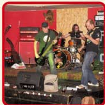
Ethno Funk Fesztivál