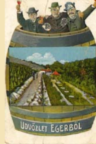
Az előadásokat korabeli fotók illusztrálják

„Aki szereti a bort, nem rúg be” – ezt nem véletlenül jelentik ki az előadók. Nincs könnyű dolguk, mert a hallgatóság összetétele vegyes, vannak közöttük, akik már „profi” borszakértőnek hiszik magukat, mások azonban még az alapfogalmaknál tartanak. Ezért is hangsúlyozzák állandóan a borkultúra ismeretének és alkalmazásának fontosságát a szakemberek. A borkészítés, kezelés, fogyasztás, forgalmazás írott és íratlan szabályainak megtartására tanítanak. Megismerhetik a borszőlő minőségét befolyásoló tényezőket, továbbá a must készítését, az érlelést. A bor első-