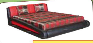
Franciaágyak többféle színben!

Az akció egyes bemutató és raktári darabokra vonatkozik 2011. 05. 31-ig, illetve a készlet erejéig!