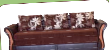
Kanapék nagy választékban!