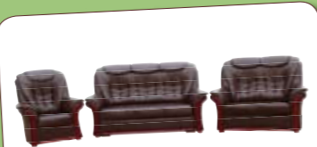
Santiago 3-2-1 Ágyazható, textilbőr. Szuper ÁR: 239 000 Ft

Nappali, háló, ifjúsági, étkező és konyhabútorok nagy választékban!