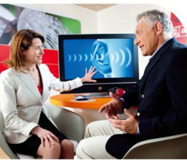
A hirdetés nem rendelkezik ajánlattal, nem tekinthető. A részletekért érdeklődjön az Amplifon Hallásközpontban.