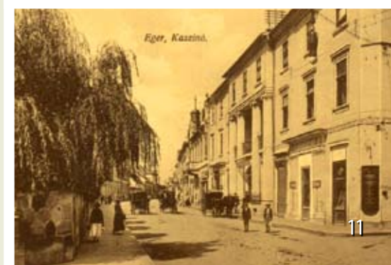
Az Úri Kaszinó épülete 1906-ban