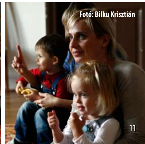
Fotó: Bilku Krisztián