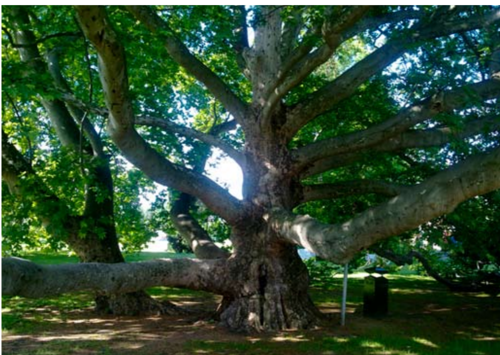
A győztes egeri platánt indítják 2013-ban az európai megmérettetésen