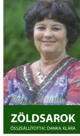
ZÖLDSAROK ÖSSZEÁLLÍTOTTA: DANKA KLÁRA