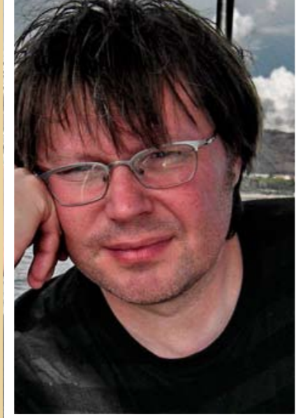
A filmet írta és rendezte: Bollók Csaba

ber elején visszatértünk. Gyönyörű indián nyár volt, megcsináltuk a szüreti jelenetet napfényben, igaz ezen a napon már csak az a néhány sor fehér szőlő került felvételre. A film október 17-i premierjén az Egri Csillag Superior bor kóstolójára is sor került a filmben szüretelt szőlőfűrtök levéből.