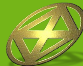
Lichtmatrix Technológia felhasználásával

Szalagfüggöny-, szőnyeg-, kárpittisztítás és épülettakarítás. Magánszemélyeknek és cégeknek egyaránt.