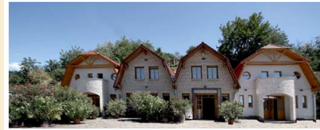
Új épületek, modern technológia. Feldolgozástól a vendéglátásig

Parasztzűlök gyermeke, beleszületett a szőlészet-be. Felmenőitől örökölte a szőlő és borkultúrát, amit kísérletező kedvvel fejleszt és gazdagít. Segítségére van felesége, s a fővárosban élő közgazdász képzett-ségű, számviteli főiskolát végzett lányuk, akinek jó érzéke van a marketinghez is. 2006-ban döntött úgy a család, hogy a megnövekedett technikai-techno-lógiai követelményeknek és piaci érvényesülésüknek eleget tesz, kibővíti a Kistályai úti pincészetet. Először négy, egyenként 50 méter hosszú alagutat vájtak a riolittufába: egyedülálló pincerendszert hoztak így létre boraik érlelésére, tárolására. A jelenleg ötágú, 1100 négyzetméteres pincét esztétikájá teszi egyedív: nincs boltzata és belső burkolata. A kivájt alagútban a hegy kötömegeit szinte érzékelni lehet. Magam is ezt tapasztaltam a patikatisztaságú járatokban. „Mire van leginkább szüksége a bornak? – kérdezi fennhangon. A tisztaságra! – válaszolja a fejtéssel foglalkozó munka-társai egyetértésével. Minden borhához tartozik egy pinceág. Helye van itt a feldolgozásnak, a palackozónak, a termelői borkimérésnek és a vendéglátónak