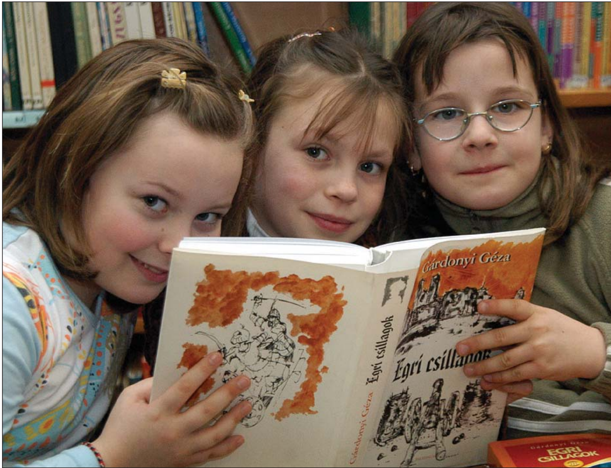
Mi is Gárdonyi Géza regényét olvassuk

Az azóta ismertté vált végeredmény szerint nem volt hiábavaló szorítani a város „legnagyobb marketingese”, az egri remete, Gárdonyi Géza művének a sikeréért: a regény, túl azon, hogy a vigaszágon a közönség beszavazta a döntőbe, a legfontosabb voksoláskor is a legtöbb szavazatot kapta, megelőzve Molnár Ferenc A Pál utcai fiúk, illetve Szabó Magda Abigél című művét. Érdekessége a végszavazásnak, hogy az „előcsatározások” során egy alkalommal alulmaradó Egri csillagok épp A Pál utcai fiúkkal szemben esett ki az egyenes ágról, s jutott tovább vigaszágon.