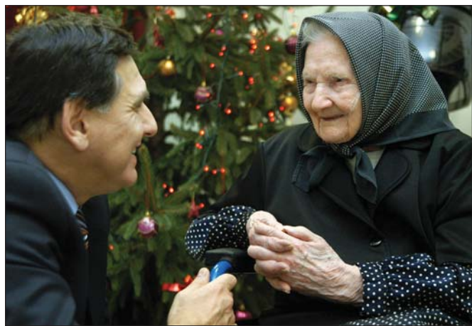
Polgármesteri látogatás a város legidősebb és legifjabb emberénél