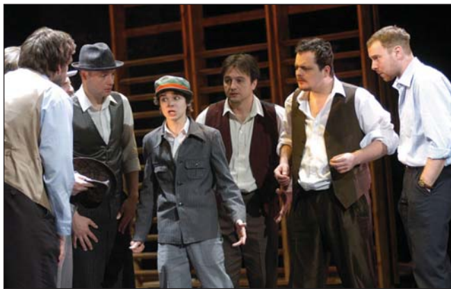
A Pál utcai fiúk Egerben