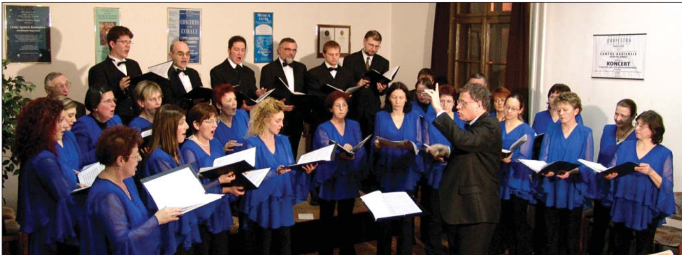
A Cantus Agriensis koncertet adott a Magyar Kultúra Napja alkalmából