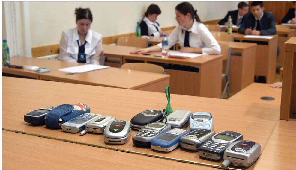
Vizsgakezdés. Ők már eljutottak az érettségig

A jelentkezők a vizsgákat követően, március 16-17. között módosíthatják a tanulói adatlapon feltüntetett rangsort. Az általános iskola a módosított (végleges) tanulói adatlapot 2006. március 20-án megküldi a Felvételi Központnak.