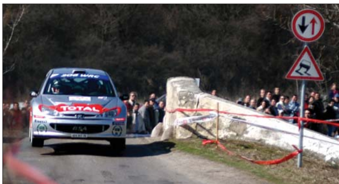
Az Eger Rallye emlékeztetése pillanat Eggerszázlóknál