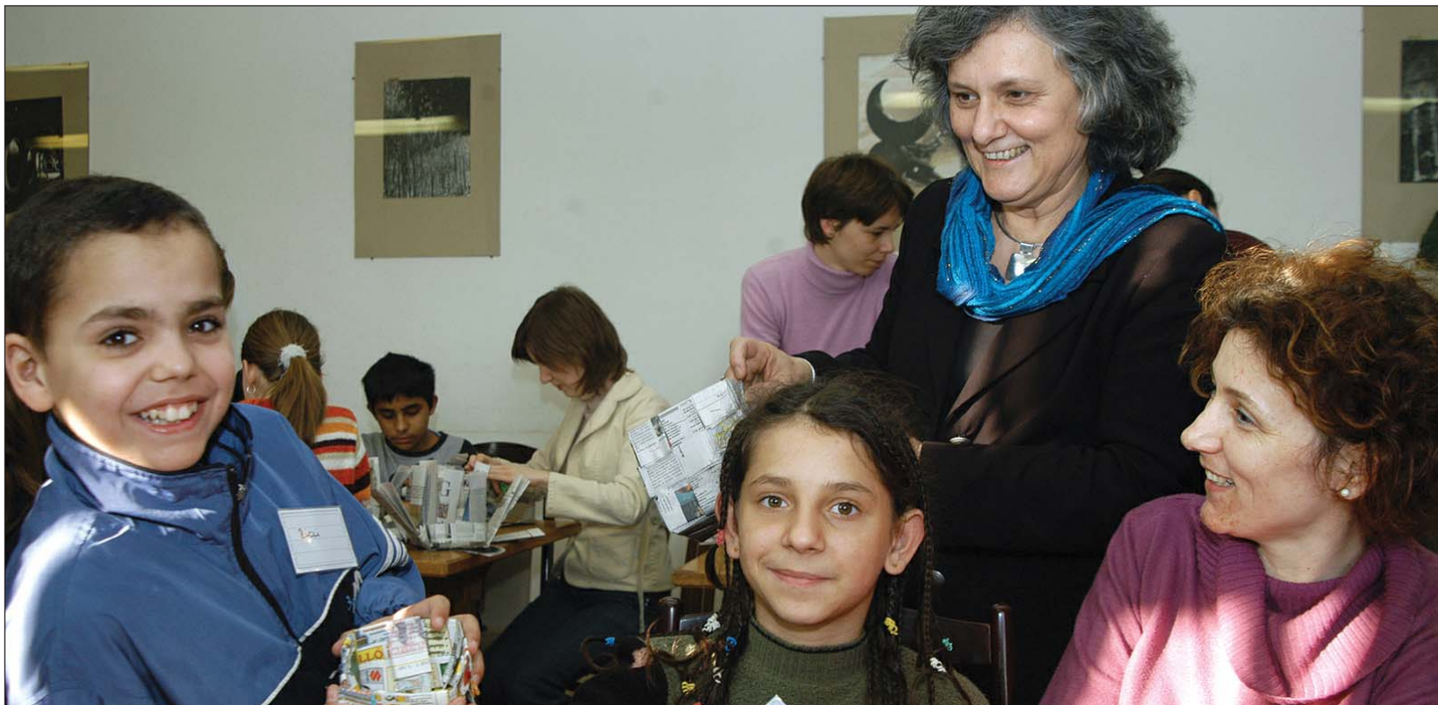
„Fogadj el!” – együtt a miniszterrel az Esélyek Házában

Göncz Kinga a művelődési központban előbb az Egri Civil Kerekasztal és az Egri Diáktanács képviselőivel találkozott, majd részt vett azon a „Fogadj el!” elnevezésű foglalkozáson, amelyen az Egri Esélyek Háza által patronált középfokú értelmi fogyatékos, illetve az egészséges gyermekek közös rendezvénye zajlott.