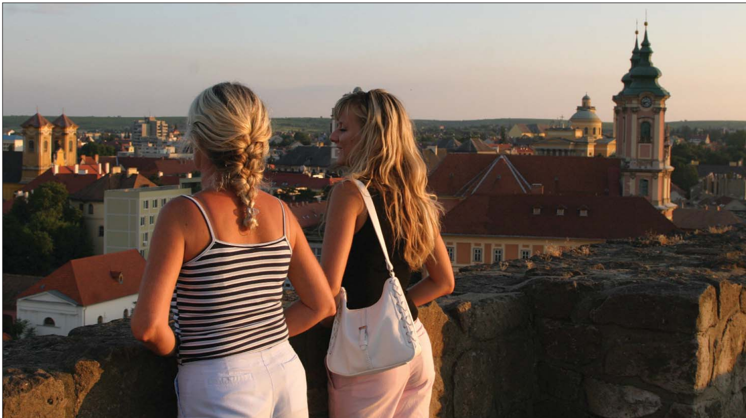
Ahová vissza kell jönni. Egri naplemente a történelmi falakról nézve