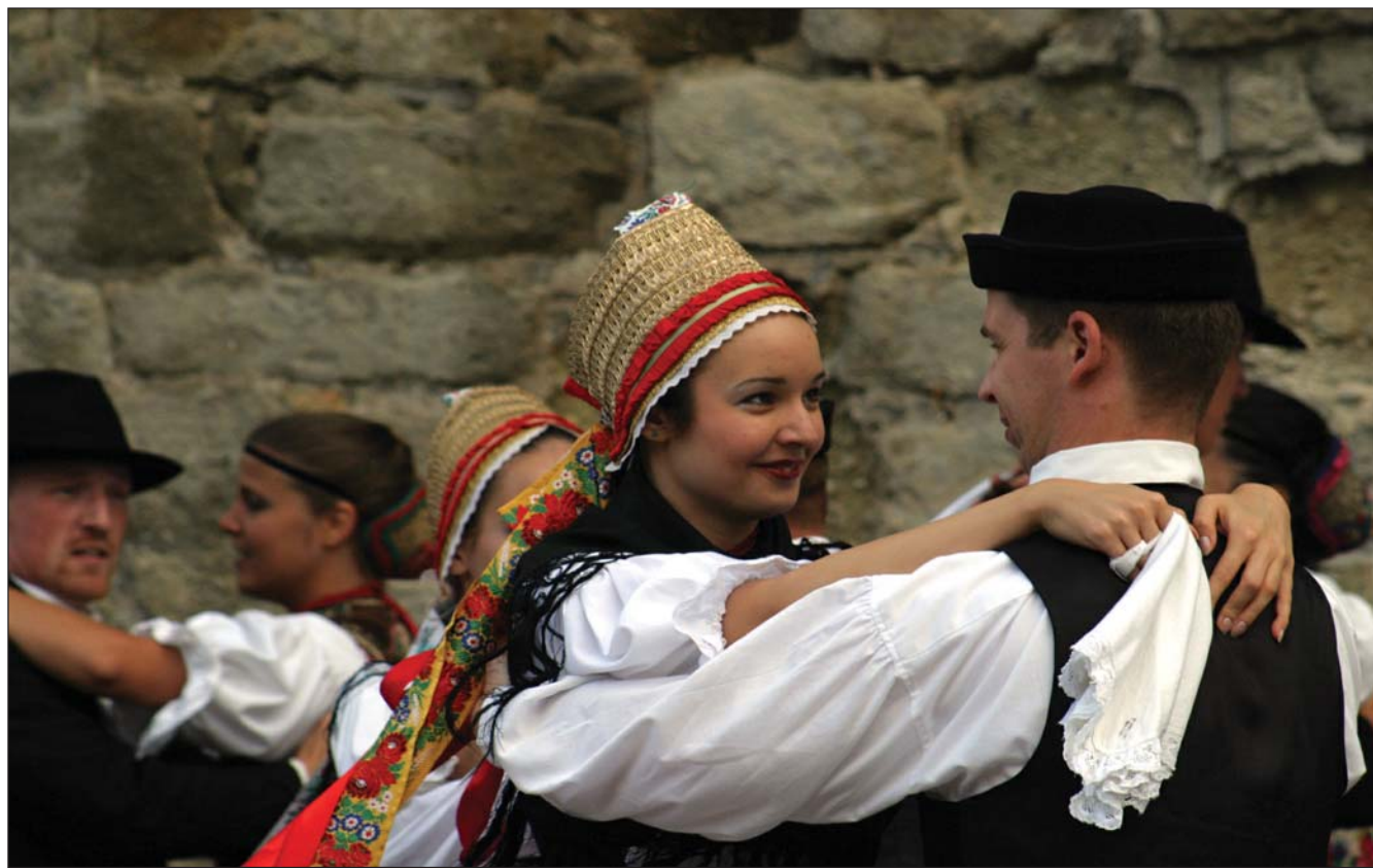
Nemzetközi néptánc-találkozó, táncgála és népzenei gála szerepel a nyári folkprogramok sorában

Bükk Hegyikerékpár Maraton Helyszín: Eger, Berva-völgy Információ: Nagy Sport Egyesület www.bukkmaraton.hu