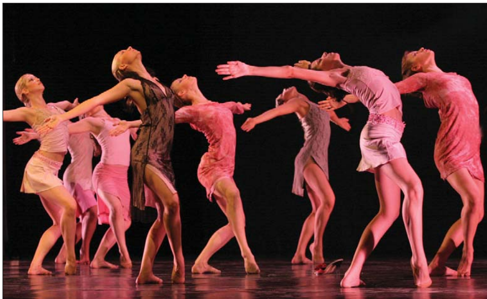
A tánc az idén is főszerepet kap a fesztiválprogramok idején