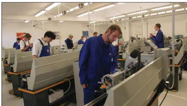
A legkorszerűbb gépeken tanulnak

együtt: az Andrássy György Közgazdasági Szakközépfiskola, a Bornemissza Gergely Szakközép-, Szakiskola és Kollégium, az Egri Kereskedelmi, Mezőgazdasági, Vendéglátóipari Szakközép-, Szakiskola és Kollégium, a Kossuth Zsuzsa Gimnázium, Szakképző Iskola és Kollégium, az Arany János Általános Iskola és Szakiskola és az IQ Informatikai, Közgazdasági és Nyomdaipari Szakközépfiskola.