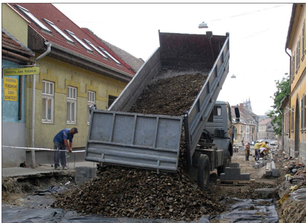
A Szent Miklós városrészben jelenleg a mélyépítési munkákat végzik