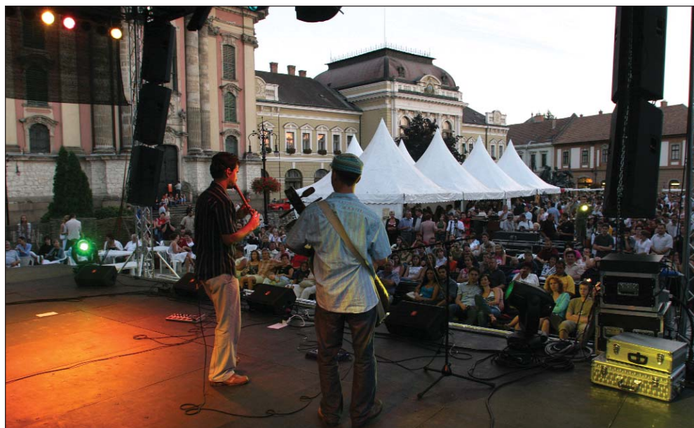
A Dobó tér számos program központi helyszíne az idén is

Gárdonyi Géza Emlékmúzeum Gárdonyi Géza lakóháza - Gárdonyi u. 28. Tel.: 36/312-744; Nyitva: márc. 1-okt.31 K-V: 9.00-17.00; nov. 1-febr. 28.: K-V: 09.00-15.00