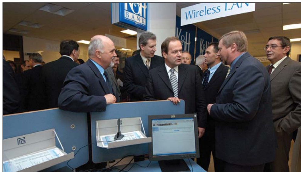
A főiskola B-épületében 2004-ben az akkori oktatási miniszter avatta az elektronikus információs központot

A szellemi gyarapodás egyik legjelentősebb lehetőségét pedig a 800 millió forint támogatással kialakított Egerfood Regionális Egyetemi Tudásközpont létrejötte jelentheti.