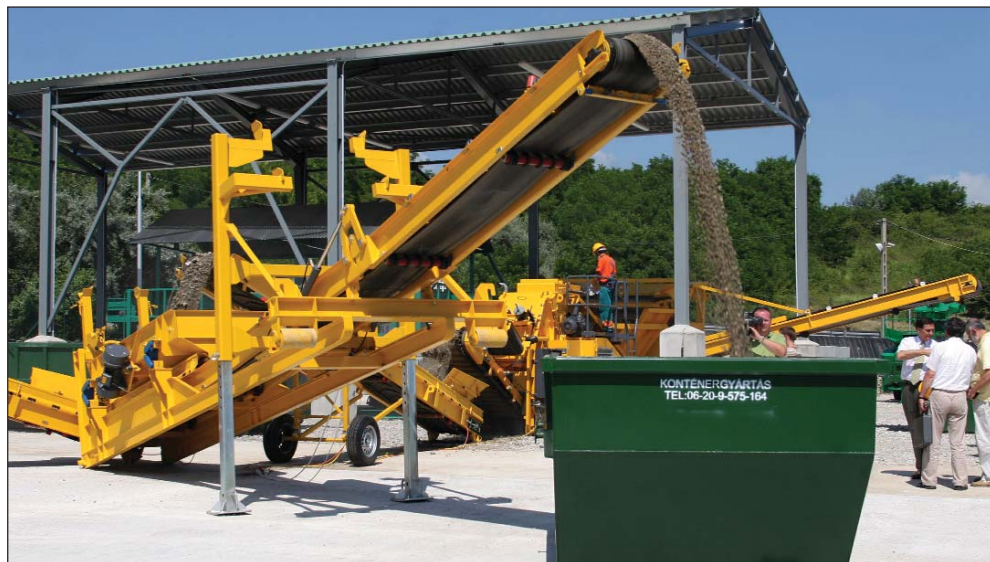
A korszerű hulladékkezelőt június 28-án adták át rendeltetésének

Érdeklődni: Eger, Bródy S. út 4. sz. alatti irodaházunkban H-P-ig 8-16 óráig (Tel.: 513-200); Eger, Homok u. 26. sz. alatti telephelyünkön H-P-ig 7-15 óráig (Tel.: 516-849, 411-144) lehet.