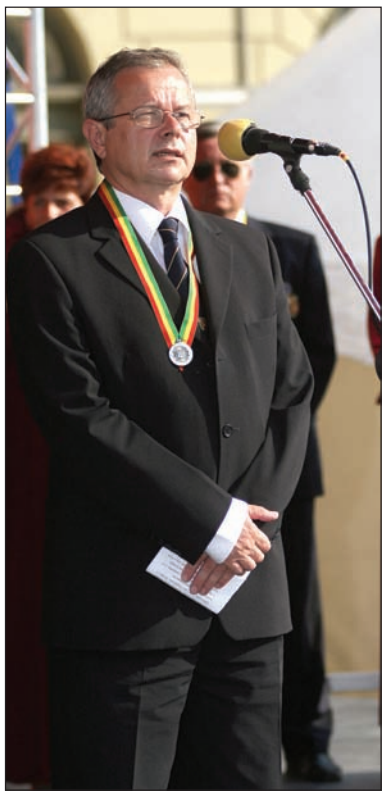
Polgármesteri megnyitó. Az Egri Bormíves Céh szervezésében zajló ötödik Bormustrát Habis László, a város polgármestere nyitotta meg az elmúlt pénteken. Az első napon a rendezvénynek a megelőző évihez viszonyítva jóval több vendége volt. A szombat esti programokat azonban elmosta egy felhőszakadás. Az időjárással dacoló fesztivál ennek ellenére elérte célját.