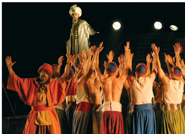
A kulturális, művészeti programok és a boros rendezvények az idén is szorosan kiegészítették egymást