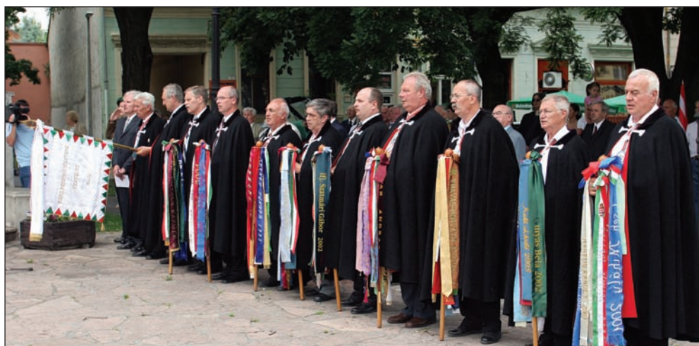
A fertálymesterek a város megannyi rendezvényén képviselik az egrieket. Képünkön a Hősök Napján hajtanak főt