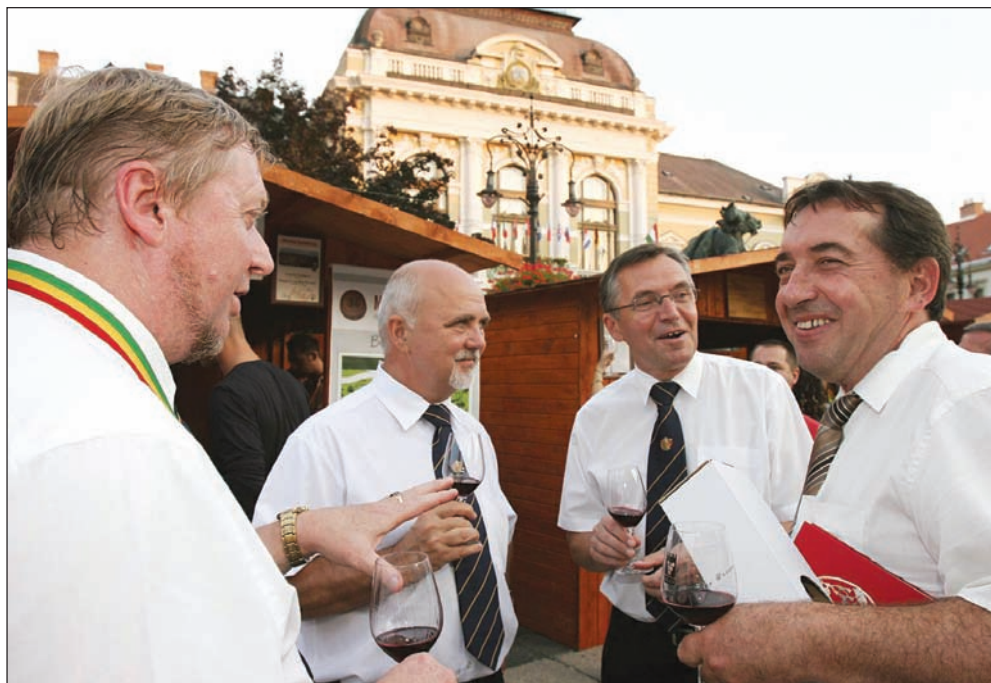
Borászok egymás között - az agrárminiszter kabinetfőnökének társaságában - az ötödik egri Bormustra megnyitóján

Várjuk szavazatát a 06-80-200-882-es zöld számon!