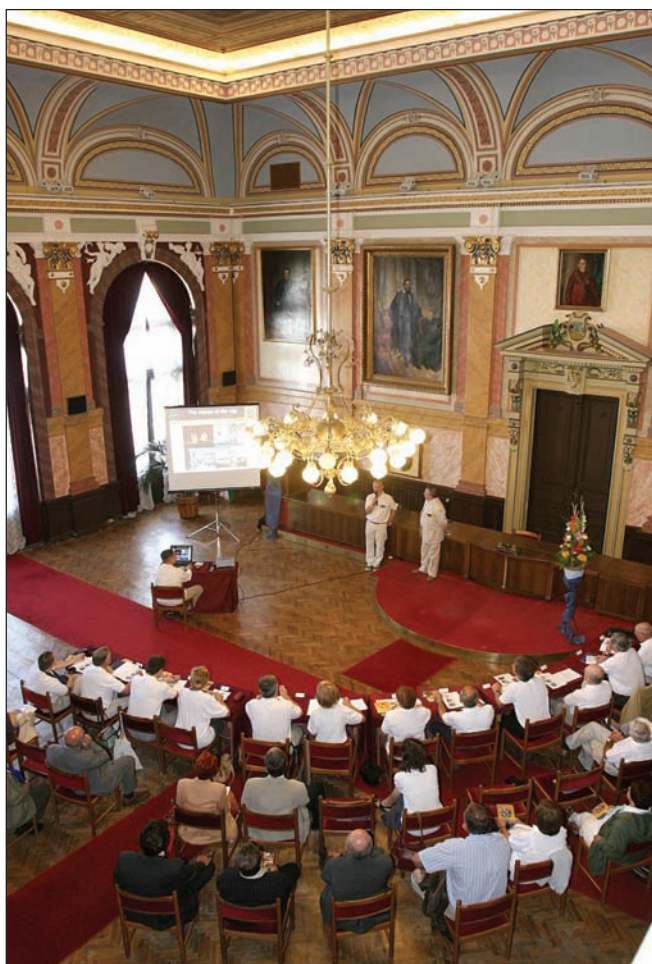
A tizenkét „virágos ember” a Városházáról indult a bírálatra

Részt vett az országos sajtótájékoztatón Habis László , Eger polgármestere, aki elmondta, hogy kezdve az iskolai, óvodai programoktól a szabadidős tevékenységig a szemlélet formá-