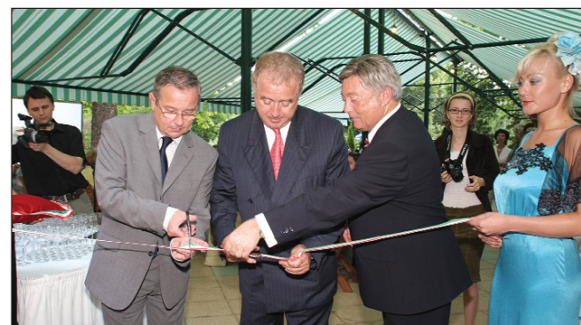
A megújult Park Hotel avatásán