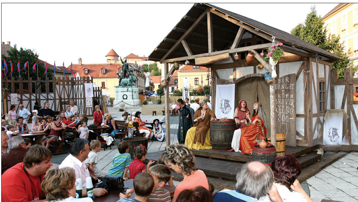
Jelenet a Középkori Piac téren. A Művészetek Háza szervezésében zajló esemény az egri nyár kiemelt rendezvénye volt

naptól fogva számos érdeklődőt vonzott. Az egri önkormányzat a 80 millió forint idegenforgalmi adóbevételeiből közel 70 milliót fordít vissza kulturális és idegenforgalmi programokra. Az egri nyár programjainak megszervezésekor fontos cél volt, hogy azok összhangban legyenek a város műemlék jellegével, értékeivel, a borral, a pincékkel, a barokk építészettel.