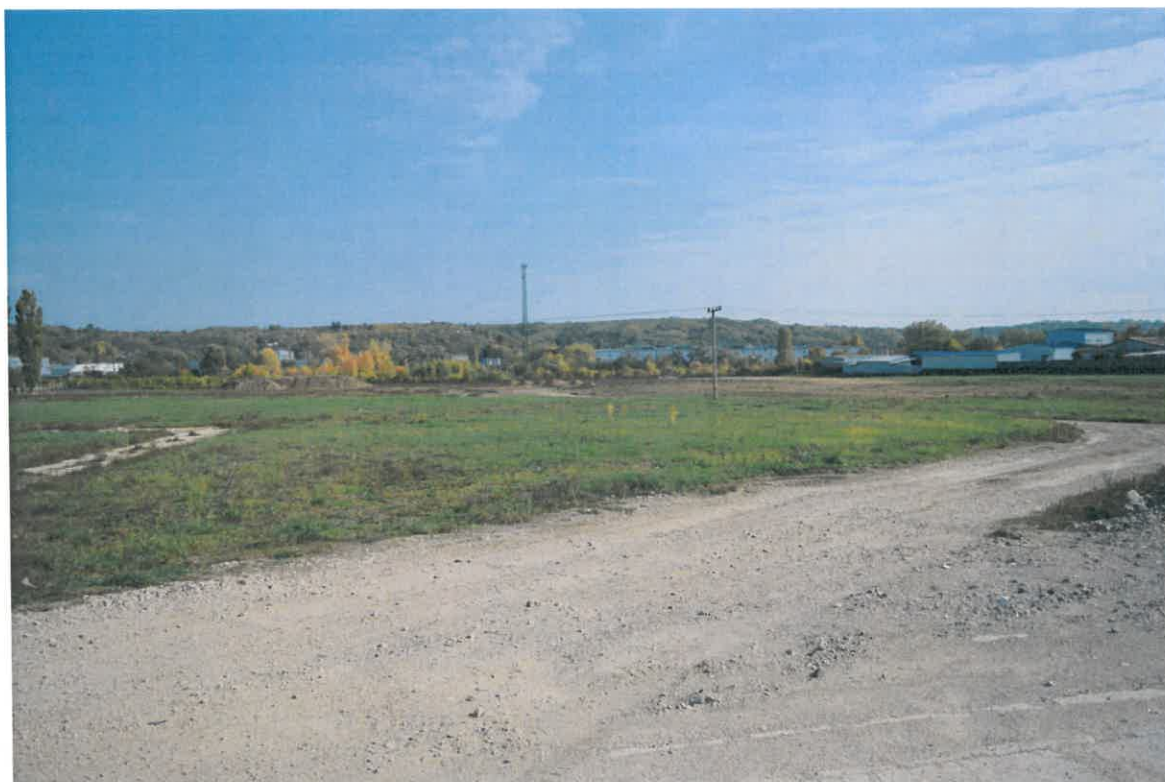
Eger, Faiskola u. 10502/3 hrsz-ú ingatlan északi részének fotója

EGER, FAISKOLA U. 10502/3 HRSZ-Ú INGATLAN