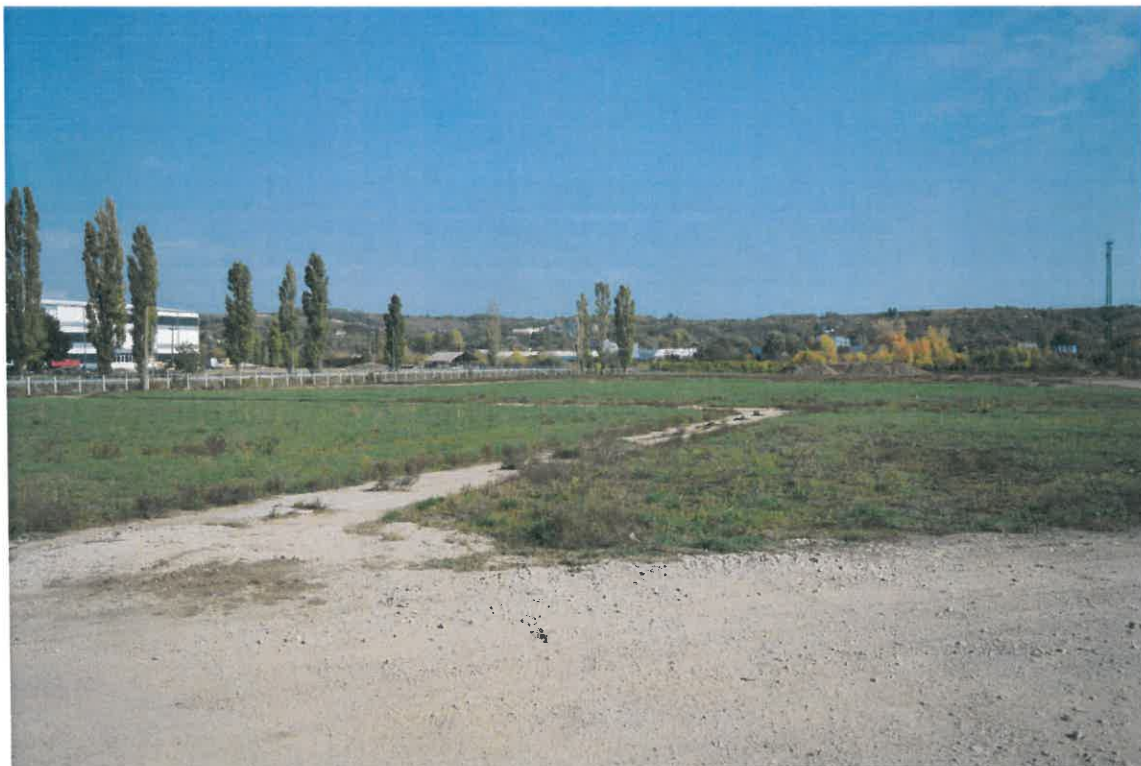
A beépítésre szánt 10502/3-as helyrajzi számú terület 2022. október 13-án, nyugati irányból fotózva.