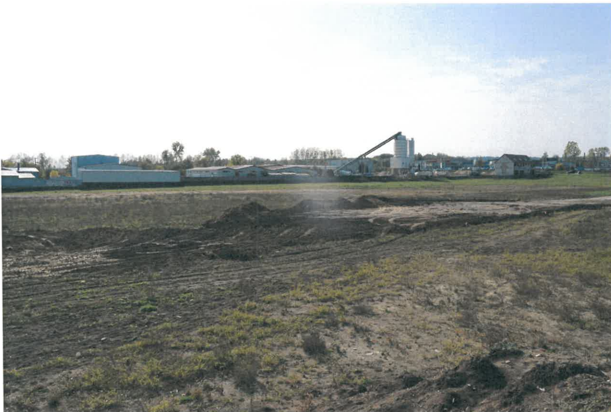
A beépítésre szánt 10502/3-as helyrajzi számú terület 2022. október 13-án, északi irányból fotózva.