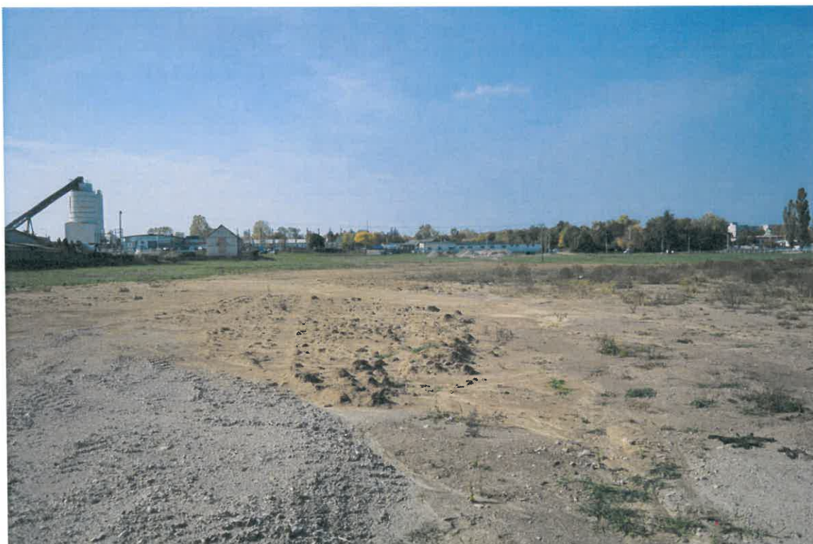
A beépítésre szánt 10502/3-as helyrajzi számú terület 2022. október 13-án, keleti irányból fotózva.