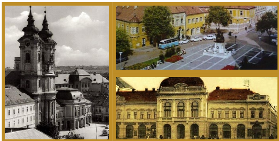
Dobó tér anno