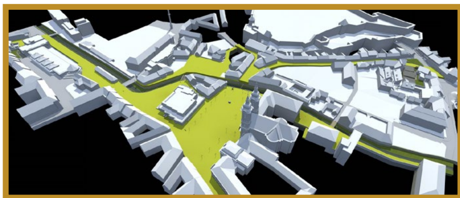
A képen zölddel jelöltük a közterületi fejlesztéseket