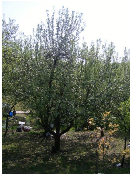
Virágzó „Egri piros” almafa kiskertben