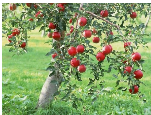
Az érett gyümölcstől roskadó fa