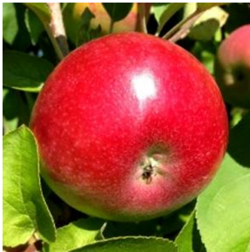
Az érett „Egri Piros”