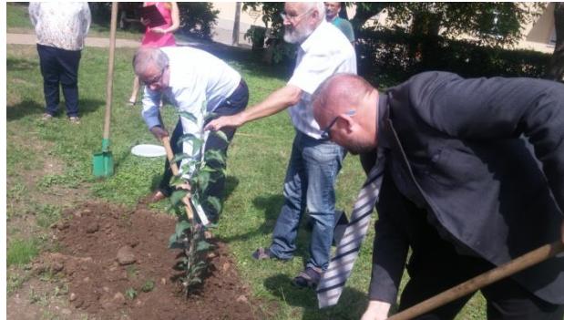
Egri piros facsemete ültetése

„Az egri piros alma a térség tájfajtája” javaslatétel fotófeliratok.