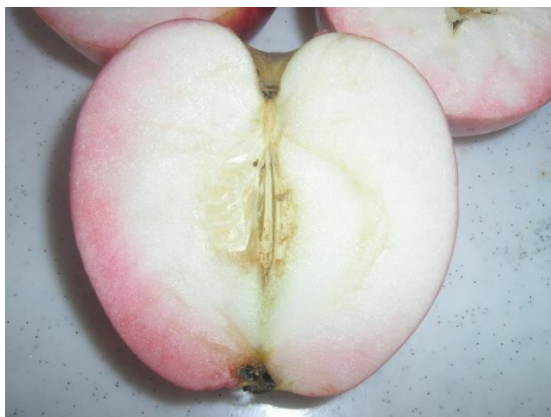
Az „Egri piros” félbevágva