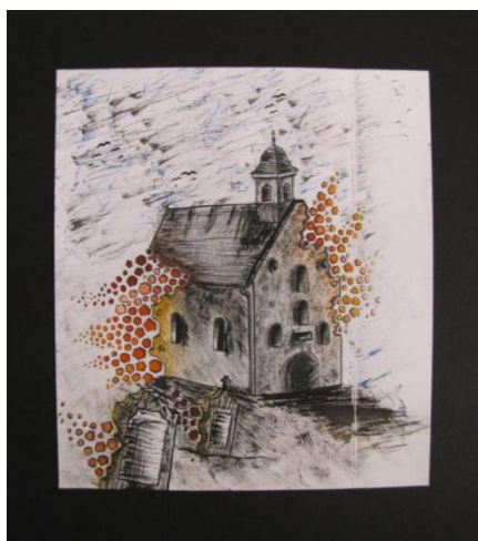
Kreatív pályázat díjazottja