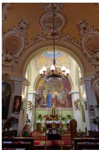
Főoltár: Egyszerű fa sztypesz és újabkori retabulum

Mellékoltár: 1. Az arcus triumphalis két oldalán XIX. sz. –i gazdag empire faragványokkal díszített aranyozott keretben balról Szt. Mihály arkangyal legyőzi a sáttant c. olajfestmény (Guido Reni után, XX. sz.), jobbról