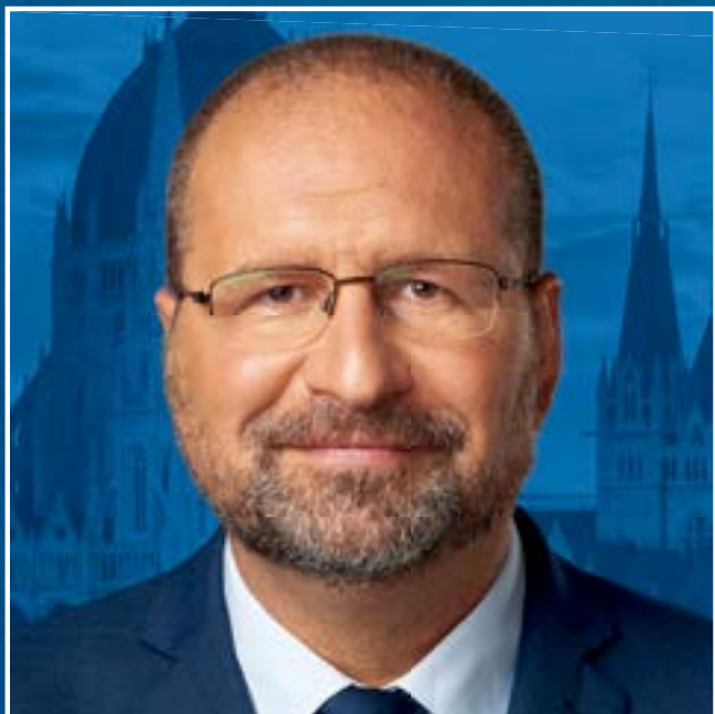
A DK jelöltje az ellenzéki előválasztáson Heves megye – 1. választókerület