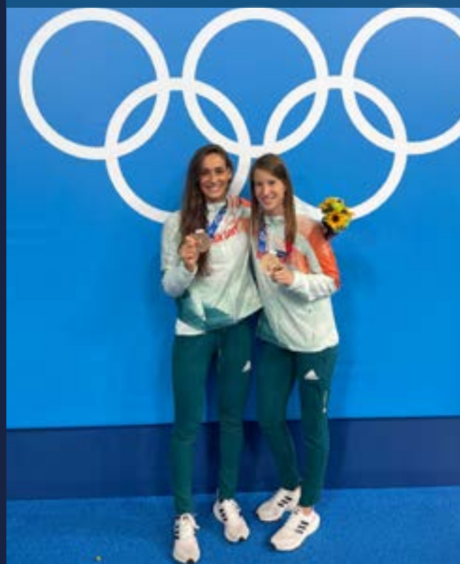
SZERZŐ: TISZLAVICZ LUCA