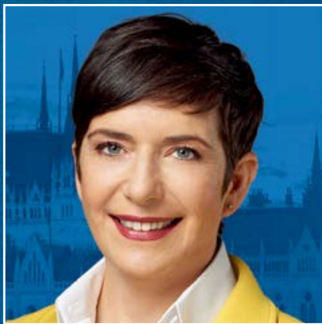
A DK miniszterelnök-jelöltje