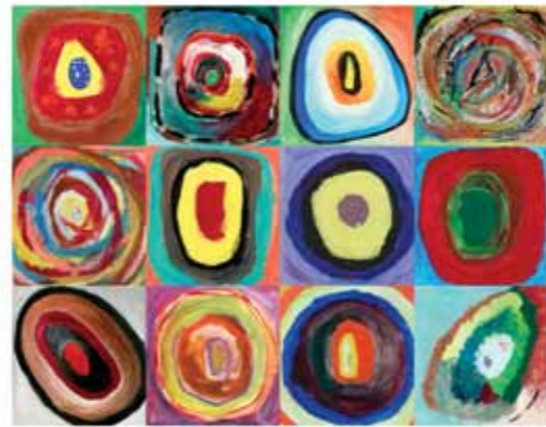
ETHNOFIL / KÓKUSZMÚZEUM

– Sokkal kiforrottabbak, kidolgozottabbak a legújabb számaink, mert a harmonikus, koherens hangzás érdekében határt szabunk az egyébként csapongó kreativitásunknak. Kissé nehezünkre esett, de ezúttal egy számon belül, három helyett általában csak egy témát dolgoztunk fel. Nem fő célunk, hogy angol nyelvű dalaink legyenek, de