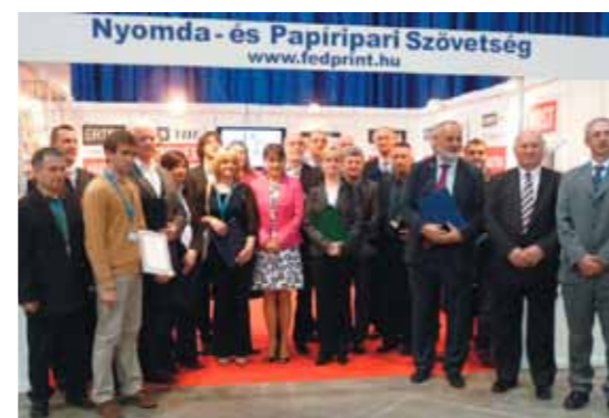
A Pro Typographia 2013 győztesei, a zsűri tagjai és a Nyomda- és Papíripari Szövetség képviselői

Az eseményen hazánk több szaksajtójának média képviselte is jelen volt,