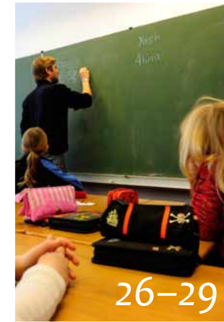
26-29 Iskolai paletta