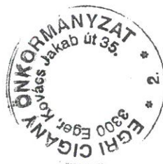
Felelős: Lakatos Oszkár