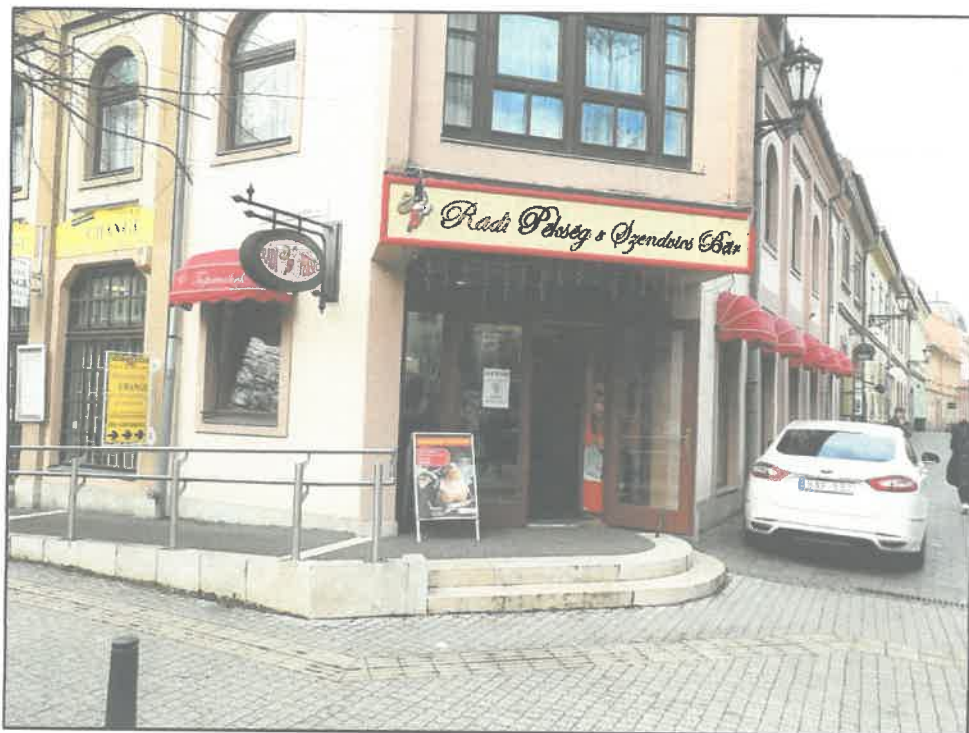
A pékség utcafrontja