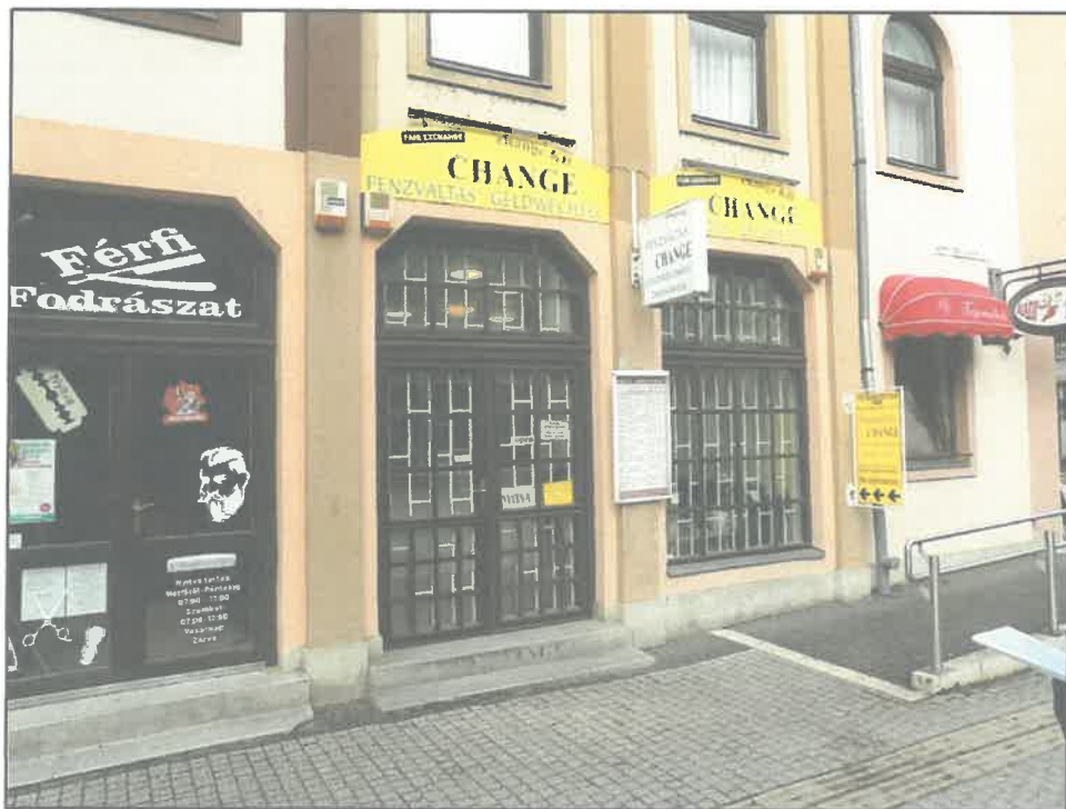
A pénzváltó utcafrontja