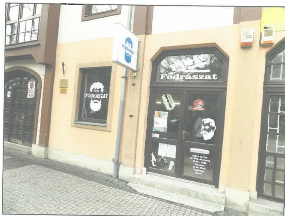
A fodrászat utcafrontja