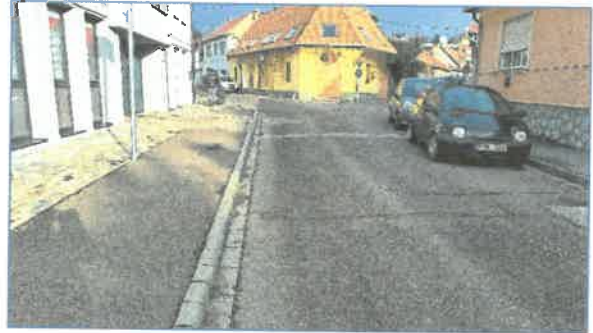
Ballasi B. u. utcakép