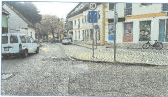
Balassi B. u. a Knézich K. u. felé