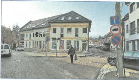
A társasház utcai homlokzata