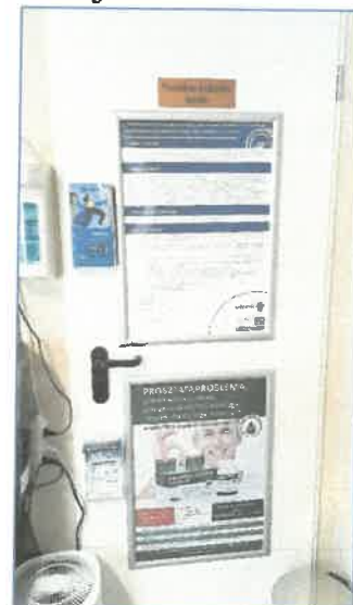
Veszélyes hulladék tároló