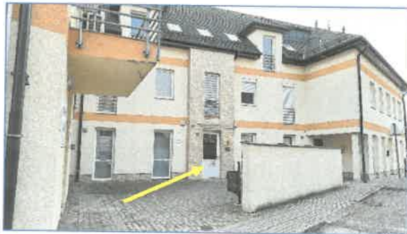
Bejárat a belső udvar felé