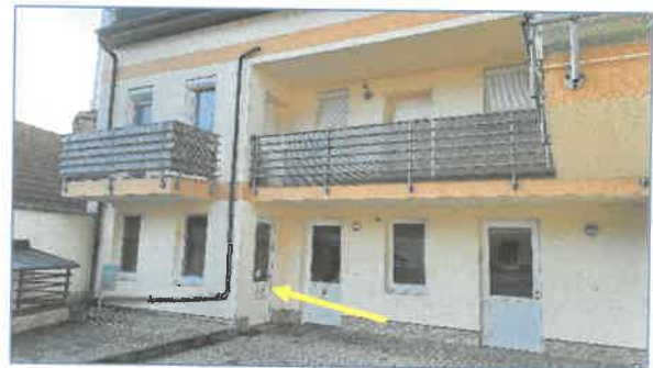
A rendelő bejárata