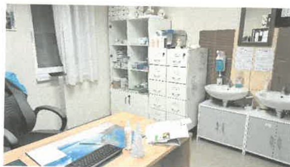
Asszisztens iroda részletek