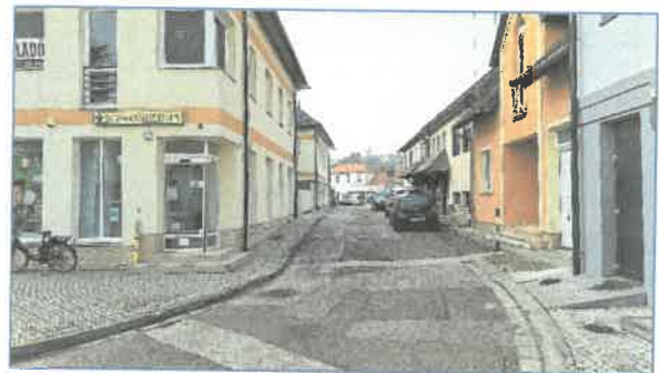
Balassi B. u. Zsákutca nyúlványa