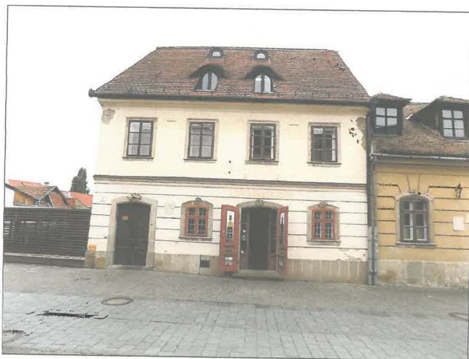
A társasház utcafrontja

Eger, Dobó István u. 1. fsz. 1. szám alatti ingatlan értékéről