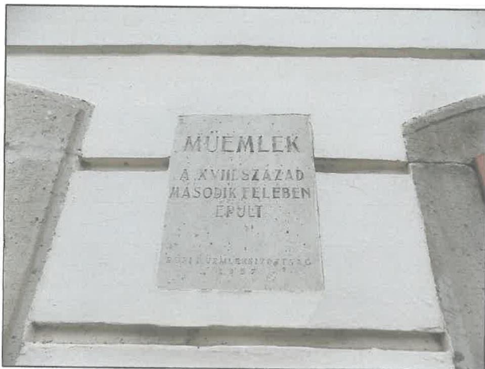
A homlokzaton elhelyezett tábla