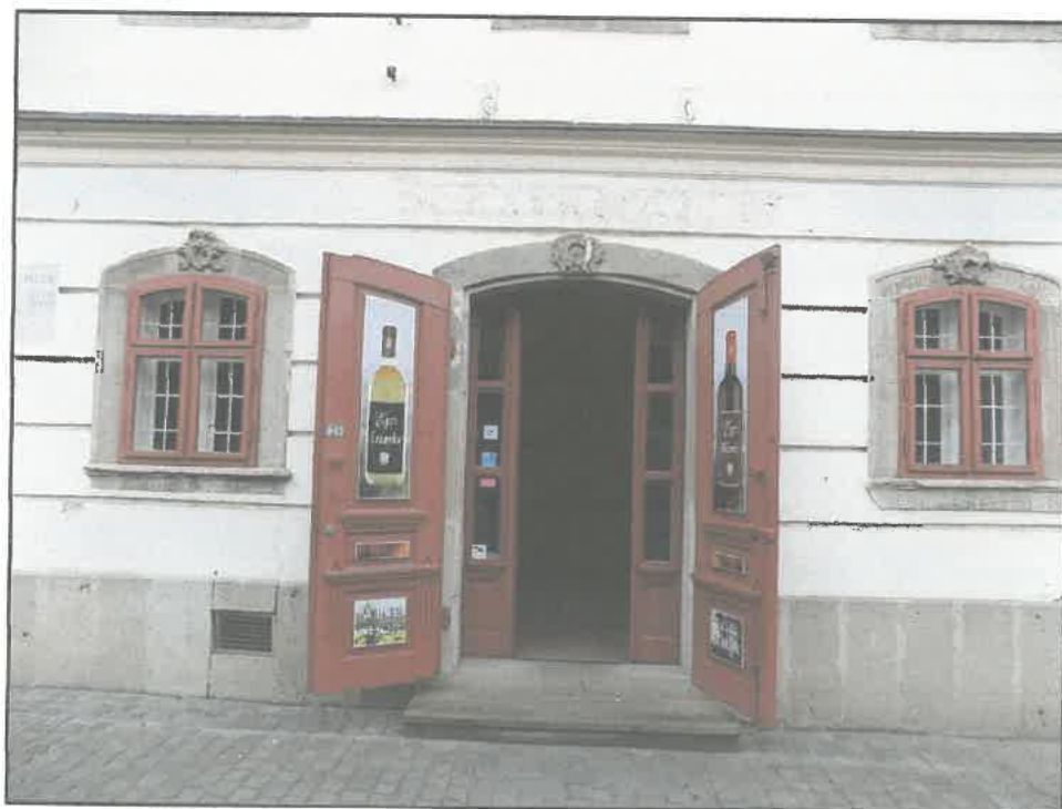
Az üzlet portálja