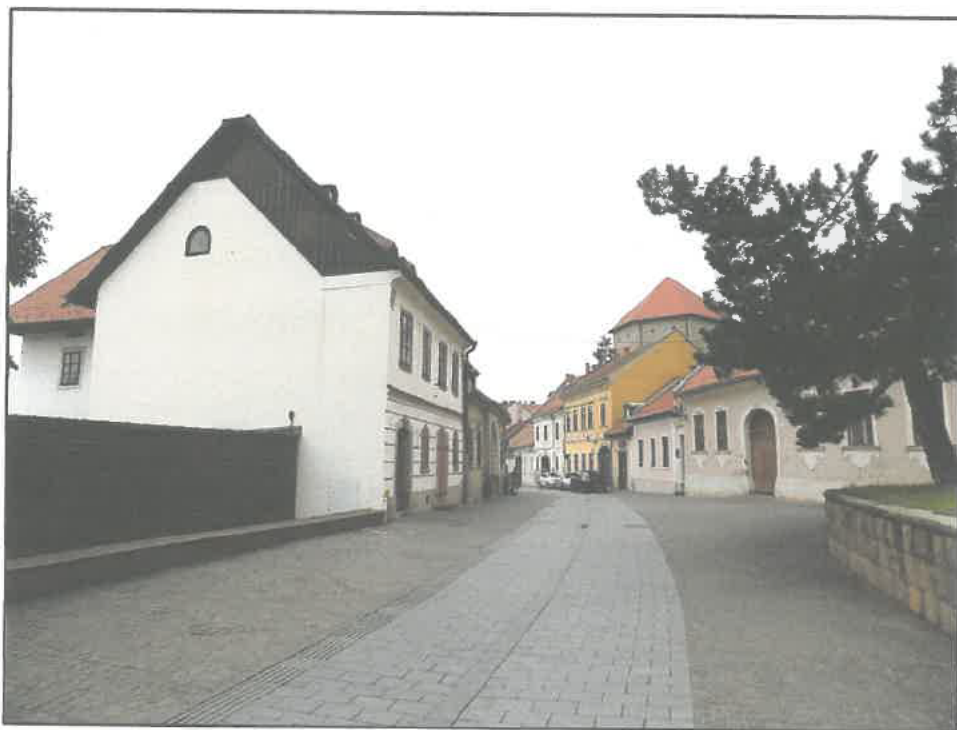
A Dobó u.