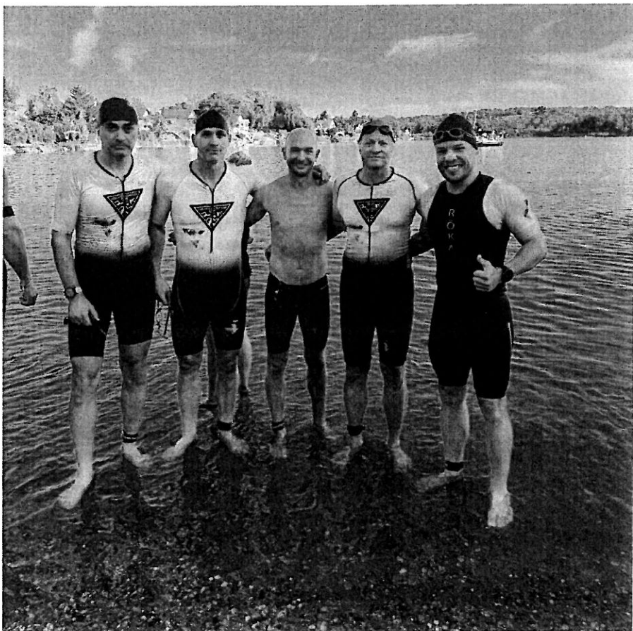
Az IRONMAN-verseny úszása előtti csapatunk.