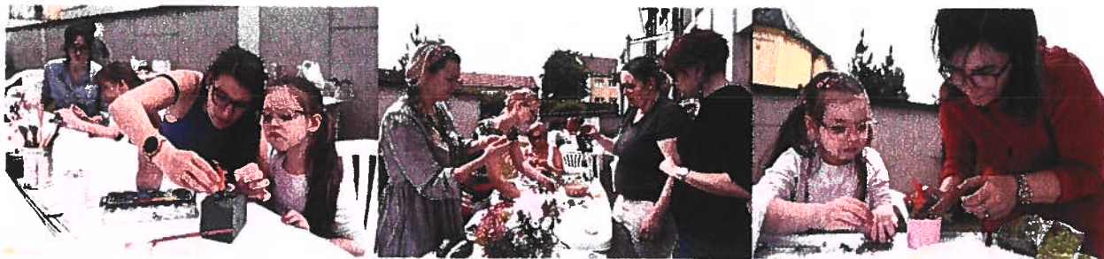
Rendhagyó primástalálkozó – 2024. május 16.