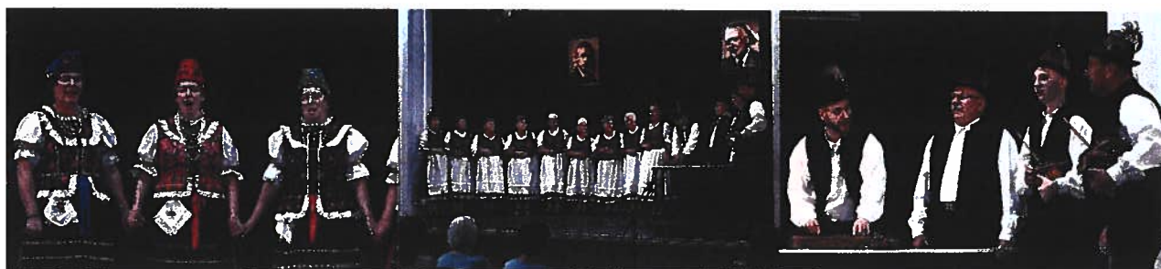
Európai Autómentes Nap - Dobó tér – 2024. szeptember 22.