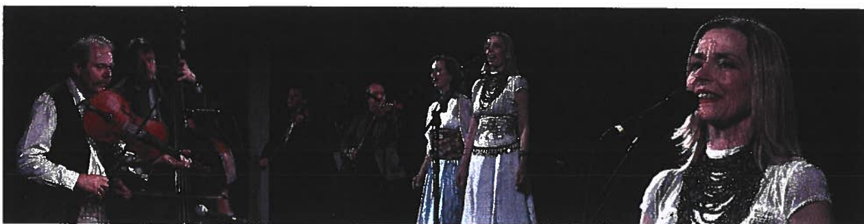
Kölyökverzsum - Városi Gyereknap – 2024. május 26.