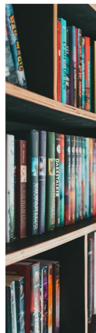
4. ábra: Könyvtári gyűjtemény