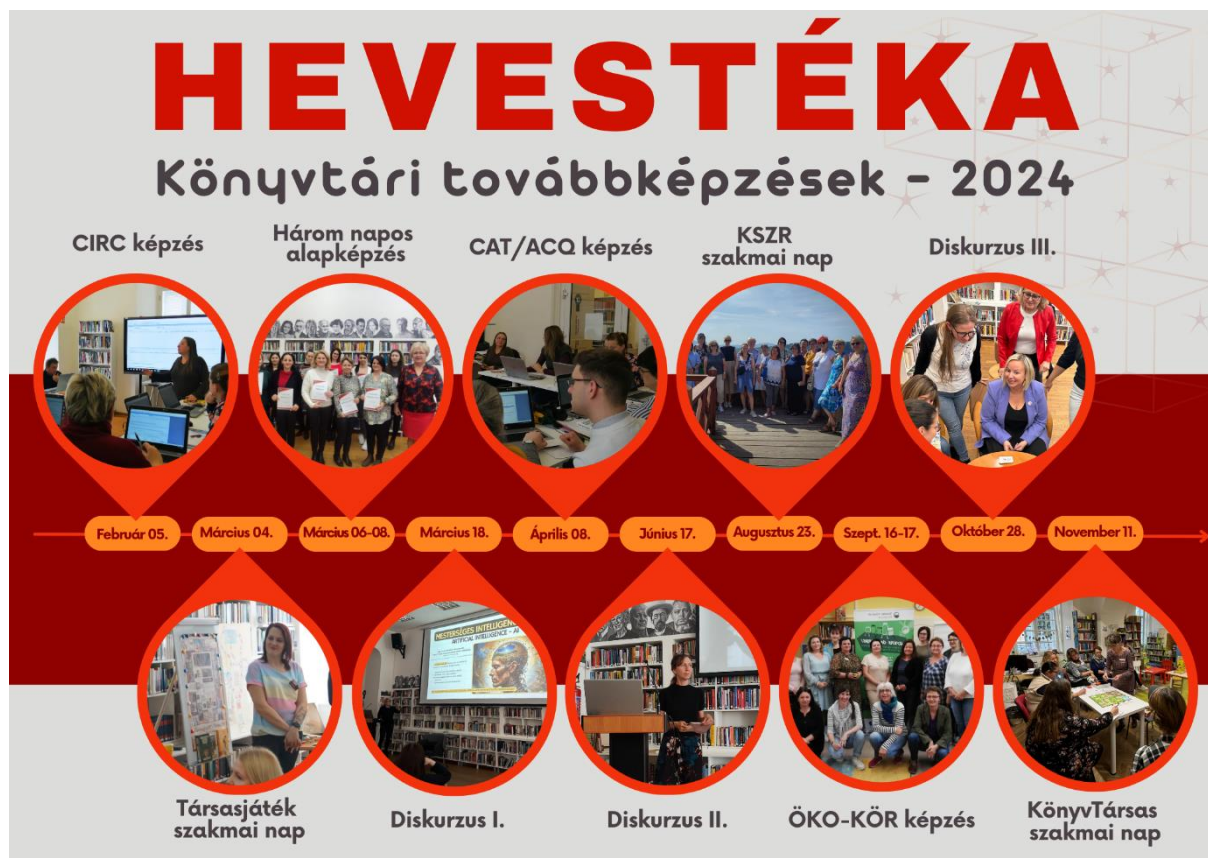
11. ábra: HEVESTÉKA – Könyvtári továbbképzések 2024