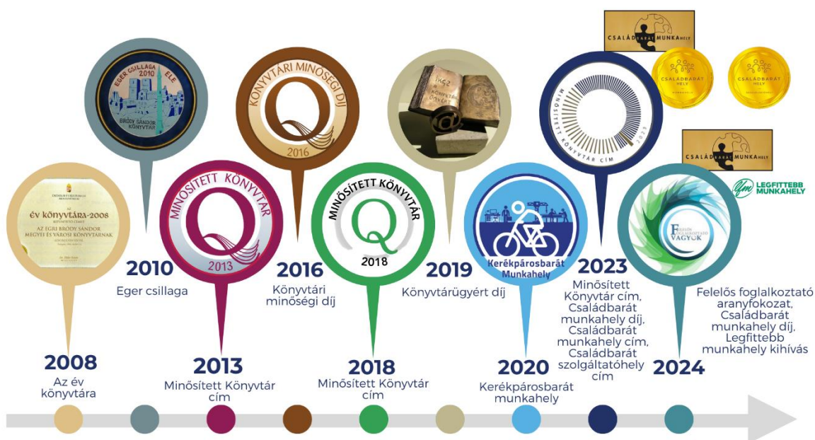
8. ábra: Minősítéseink