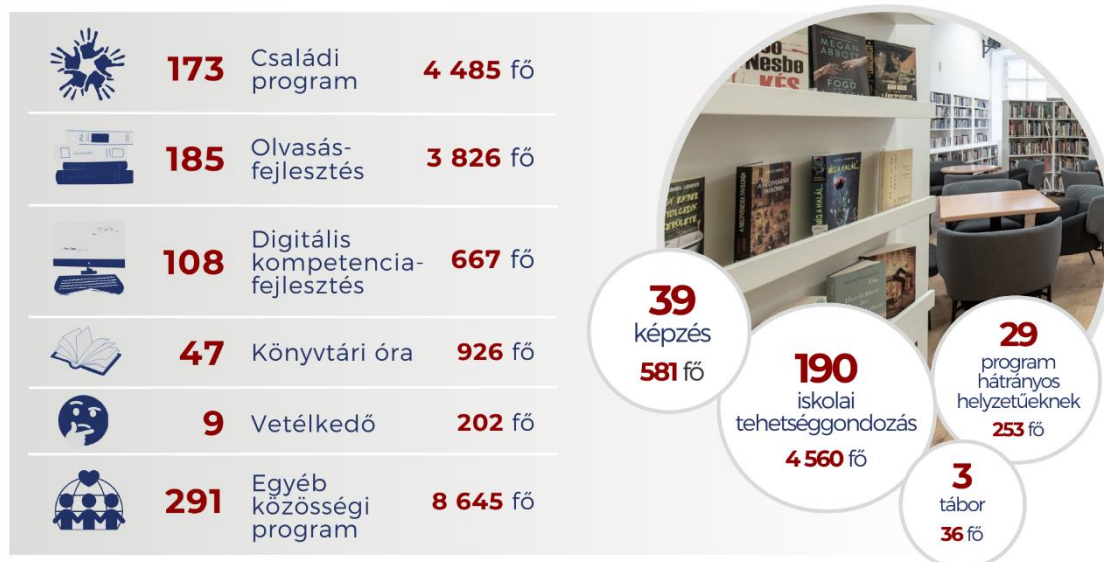
6. ábra: A könyvtár, mint közösségi tér

KÖNYVTÁRI RENDEZVÉNYEK: 1 069 program / 23 617 résztvevő