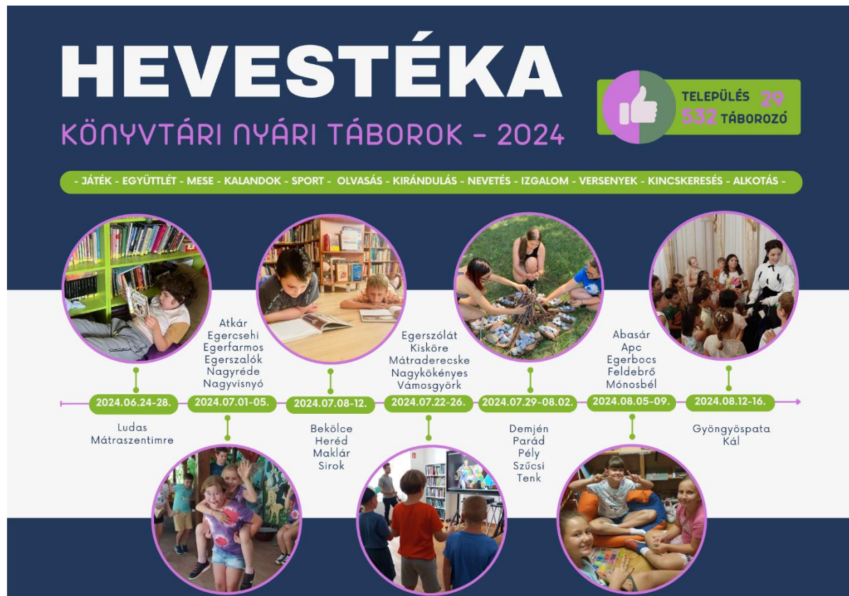
10. ábra: HEVESTÉKA – Könyvtári nyári táborok 2024

Számítógépes szolgáltatások: rendszergondozás, szervízzolgáltatás, karbantartás, vírusvédelem 120 alkalommal. 62 esetben volt távoli asztal hozzáférés segítségével hibaelhárítás, 58 alkalommal történt helyszíni IKT support szolgáltatás és összesen 124 db számítógépet szervizeltünk. Új adatbázist építettünk ki a kölcsönzési modult korábban nem használó könyvtáraknak, ezen felül 16 db felhasználói profil módosítása valósult meg.