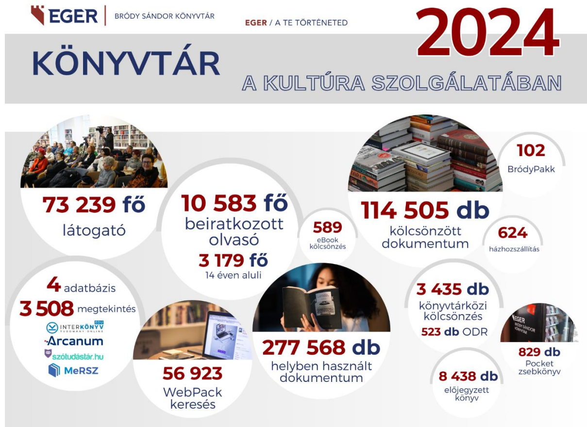
5. ábra: Könyvtár a kultúra szolgálatában

Szolgáltatásaink műfaji, tematikai élményi inspirációra épültek, megszólítva minden korosztályt.