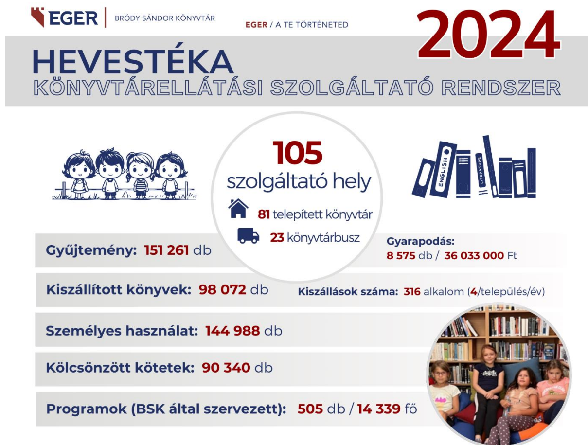
9. ábra: HEVESTÉKA – Könyvtárellátási Szolgáltató Rendszer

Együttműködés országos kampányok szervezésében: Az OKN eseményein 47 település összefogásával 184 könyvtári program valósult meg, 6 444 fővel. Az Internet Fiestán 29 település 82 programmal 1513 fővel vett részt.