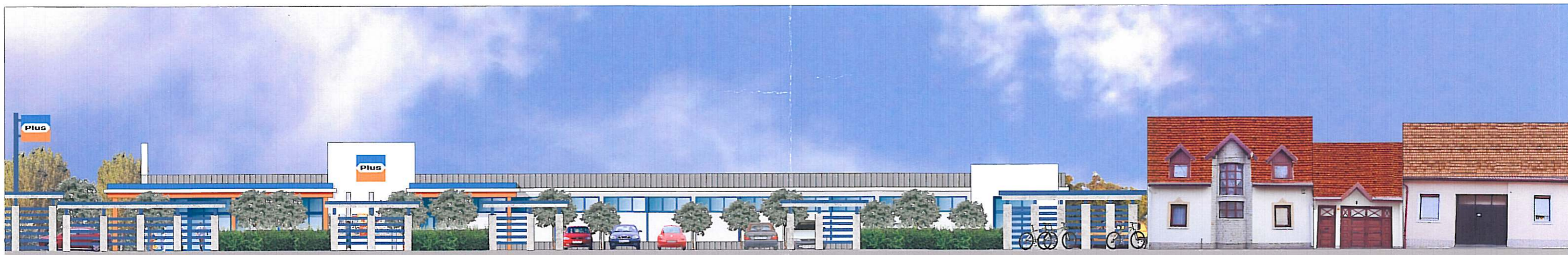
Farkasvölgy utcai utcakép