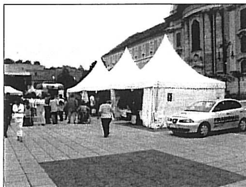
Polgárőrség Eger az Eger Ünnepén

Részt vettünk városunk civil szervezeteinek legnagyobb rendezvényén, az Eger Ünnepén, ahol bűnmegelőzési kiállítást, gyermek vetélkedőt szerveztünk, és tanácsadással, ismertető anyagokkal vártuk az érdeklődőket.