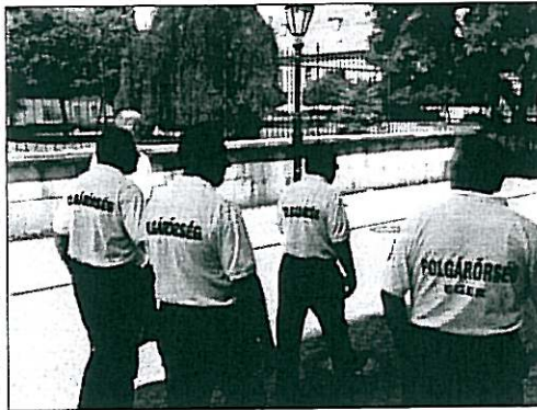
Járőreink a Széchenyi úton

Az így befolyt összegből stabilan tudtuk fedezni működési költségeinket, jelentősen tudtuk fejleszteni szolgálataink technikai hátterét. Új egyenruhákat szereztünk be, hogy továbbra is megvalósuljon a „látható polgárőrség”. Beszerzésre került 4 új URH rádió is, melyek a járőrszolgálatok és a rendezvénybiztosítások alkalmával segítik munkánkat.