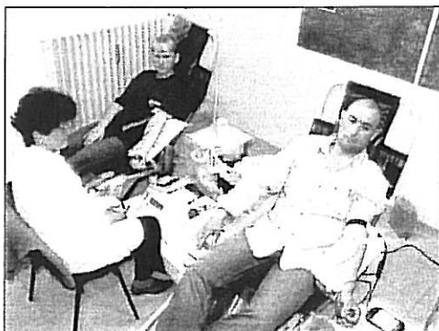
Szolgálat után vért is adtak a polgárőrök

Gyakrabban nyílt lehetőség mindkét járőrautónkkal járni a várost, ezzel is érzékeltetni a fokozott polgárőri jelenlétet.