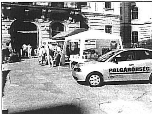
Egyesületünk az Eger Kiállítás és Vásár-on

Szintén bemutatkoztunk a Líceumban megrendezett Eger Kiállítás és Vásár-on.