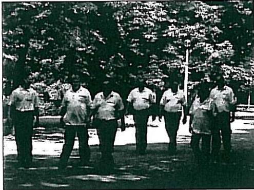
Az Érsekkeret ellenőrzése

Egyesületünk eddigi működése alatt folyamatosan változott. A kezdeti kis egyesületből kinőttük magukat, szervezett jól működő csapattá. Jelenleg a közbiztonsági és bűnmegelőzési járőrszolgálaton kívül körözött autók keresésével, áldozatvédelemmel és bűnmegelőzési felvilágosítással is foglalkozunk.